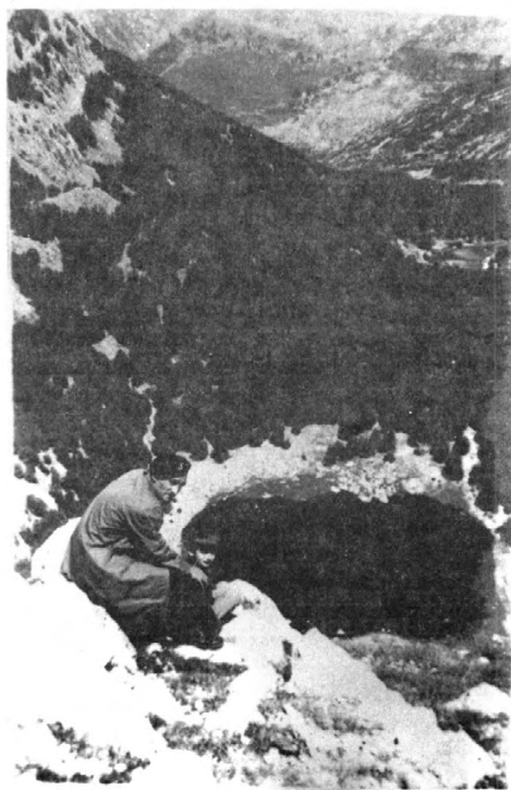
Снијежница под Језерским врхом код Језера (цирка).