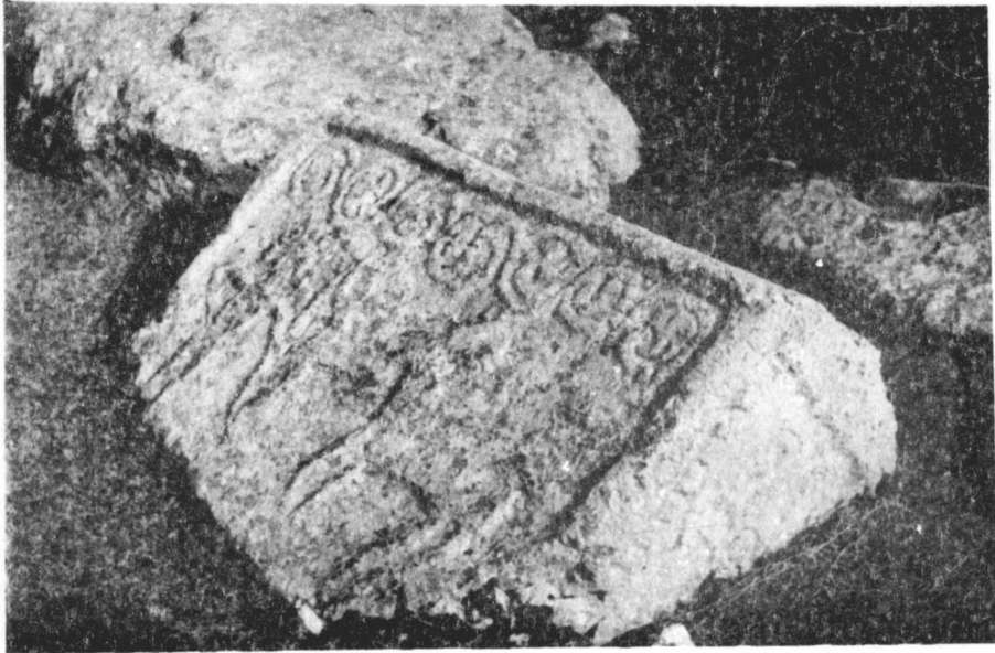
Слика 3: Мотив лова, „Грчко гробље”, у Новаковићима.