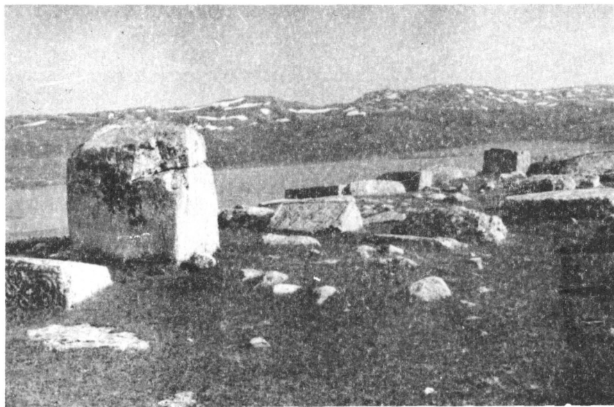
Слика 1. „Грчко гробље“ у Новаковићима