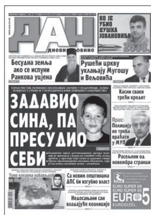
Dan, 08. 05. 2011.

kvim situacijama, ukoliko postoji javni interes, neophodno je dati kratku informaciju, bez navođenja inicijala i mjesta zločina. Glavna pravila pri izvještavanju o ovakvoj vrsti zločina su ne nanijeti štetu žrtvi i poštovati granice dobrog ukusa. U dnevnom listu Vijesti , takođe, ovakvi slučajevi dospijevaju na naslovne stranice.