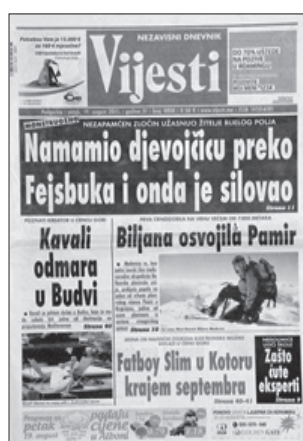
Vijesti, 19. 08. 2011.

Na osnovu višenavedenih primjera možemo zaključiti da su štampani mediji koji pretenduju na naziv ozbiljnih informativno-političkih listova postali tabloidi koji razvijaju negativnu radoznalost kod publike.