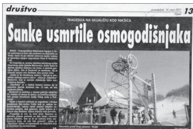
Vijesti, 14. 03. 2011.