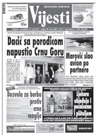
Vijesti, 25. 04. 2011.