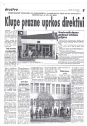
Vijesti , 24. 03. 2011.

Osim naslova, uvrjedniji su i natpisi pod fotografijama, na osnovu kojih su novinari, takođe, žigosali dijete kao okorelog kriminalca sa kojim ne može niko da izađe na kraj. Tako u članku „Klupe prazne uprkos direktivi” ( Vijesti , 24. 03. 2011) fotografija zgrade osnovne škole potpisana je: „Poprište vandalizma, a ne znanja: OŠ