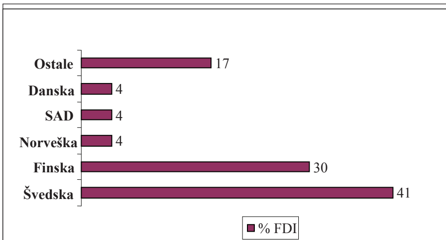
Grafik 2 – FDI u Estoniji po zemljama (decembar 2000)