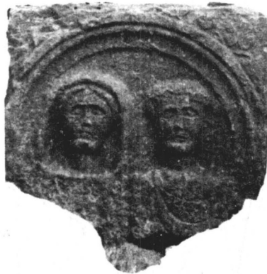
Сл. 2. Монументална гробница (Паконије Монтане).