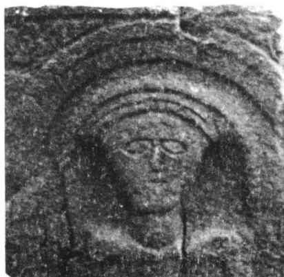
Сл. 4. Камени надгробни споменик у облику коцке са портретима покојника (вероватно брачни пар).