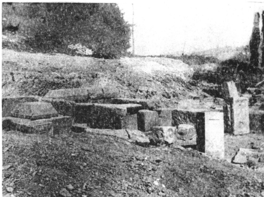
Сл. 3. Камени надгробни споменик у облику коцке са портретом покојника