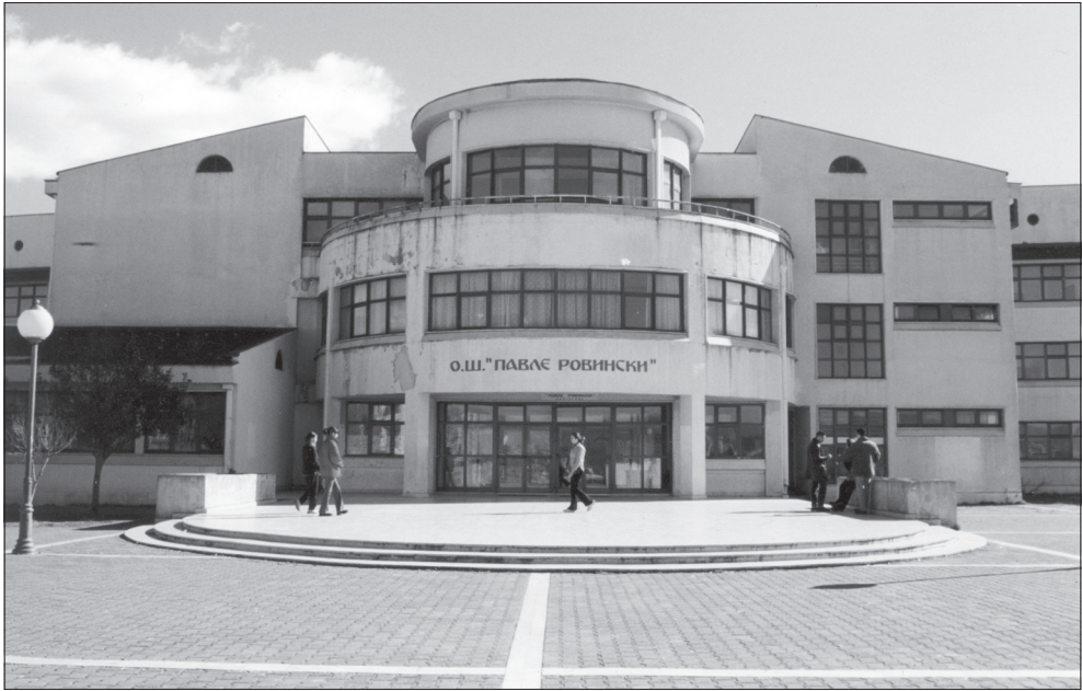
Једна основна школа у Подгорици носи име П. А. Ровинског.