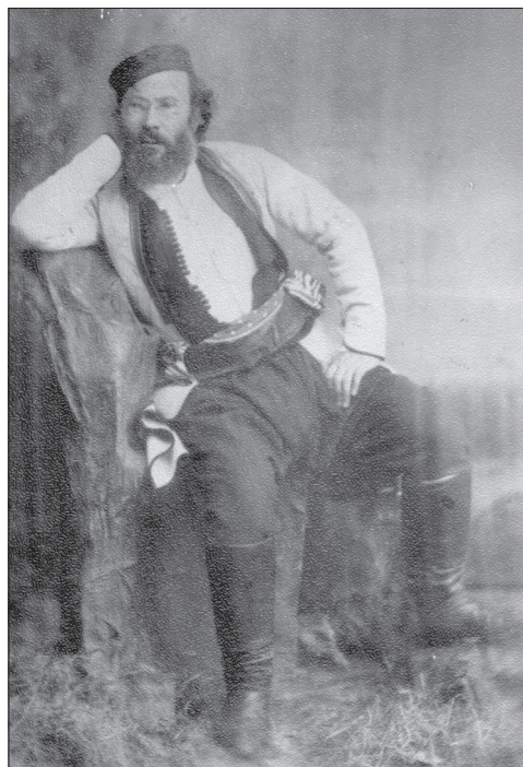
П. А. Ровински