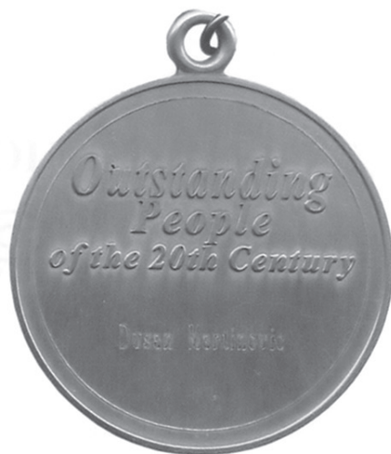
Плакета из Кембриџа — реверс и аверс (1999)