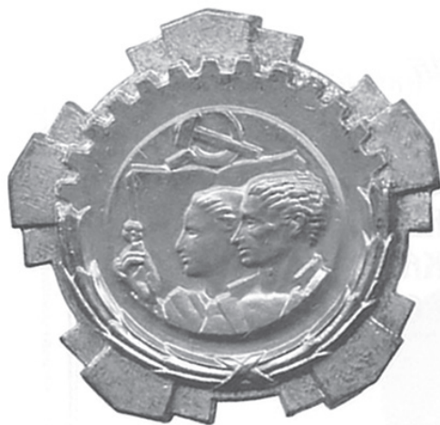
Орден рада са златним вијенцем

сти (1991) за рад у Одбору за старо штампарство;