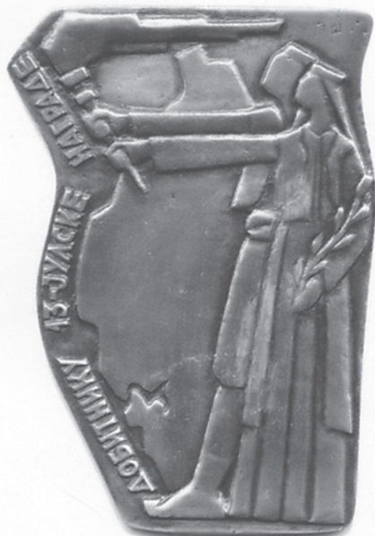
Плакета добитнику 13-јулске награде (1994)