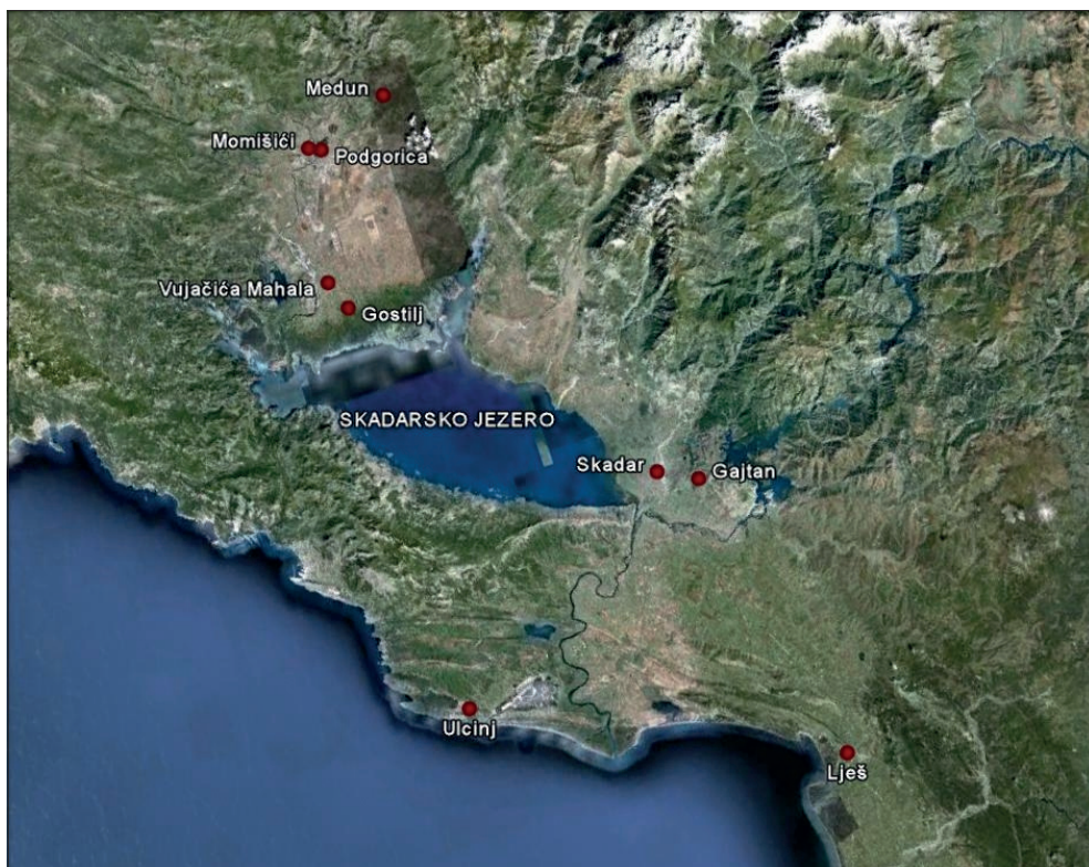
Sl. I. Savremeni nazivi gradova i lokaliteta u basenu Skadarskog jezera koji su pomenuti u tekstu

Materijalno svjedočanstvo o plemenu Labeata u periodu od kraja 3. do kraja 2. vijeka st. ere predstavlja arheološki materijal iz nekropole u Gostilju u zetskoj ravnici, koji je smješten u javnoj ustanovi „Muzeji i galerije” Podgorice [5].