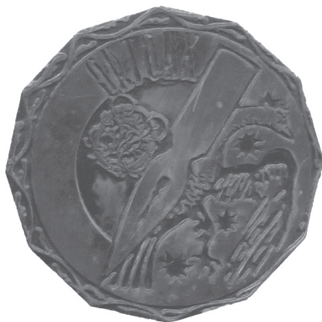
Плакета Октоих (1991)