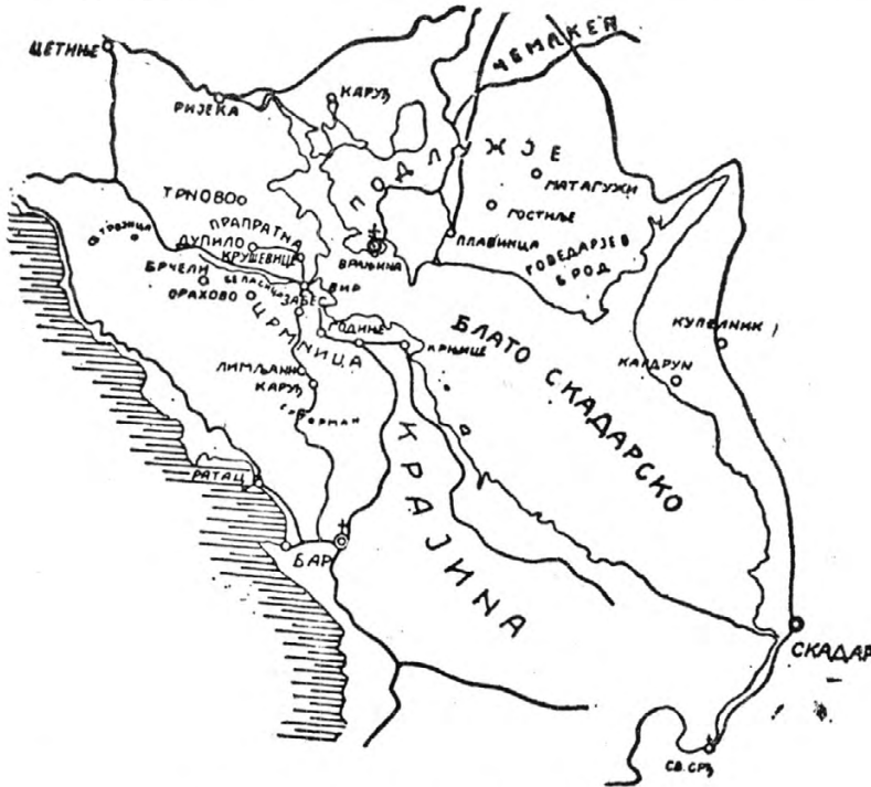
Властелинство св. Николе Врањинског 30

звало Бес, данас Бесац, уздизао град Црмница, чији се темељи и данас могу видјети. 28 Град је био лоциран супротно од данашње тврђаве на јужној страни брда, изнад саме мијелске некрополе. Предање каже да се у њему, бјежећи испред византијске војске, склонио Бодиново син Борбе и да је ту заробљен, а град разорен. 29