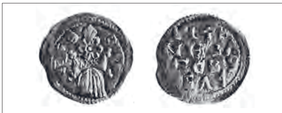
Sl. 9. Avers i revers novca Jakova

(П. Лутовац, Црква Св. Николе (Никољац) код Бијелог Поља, 31–33; В. Иванишевић — П. Лутовац, „Налаз српског средњовековног новца из цркве Св. Николе (Никољац) код Бијелог Поља”, Нумизматичар 30, Београд, 2012, 221–232.)