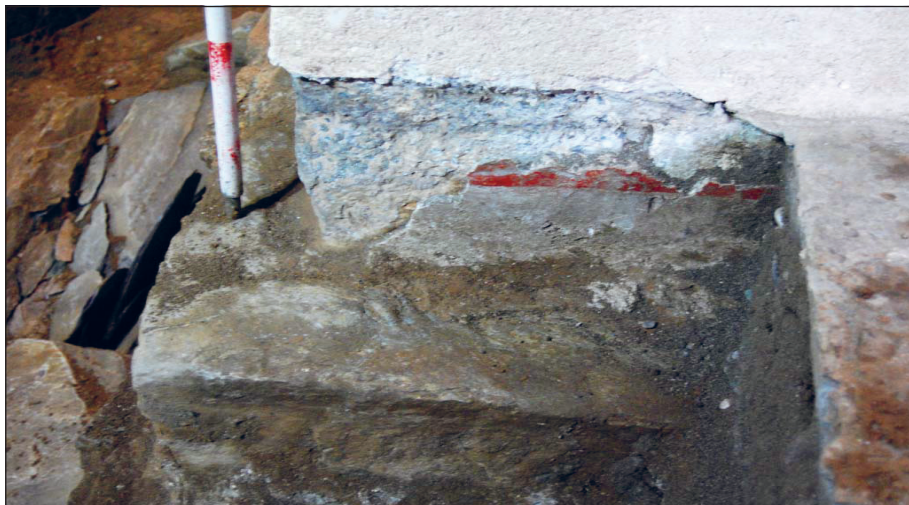
Sl. 4. Dio oslikanog sokla otkriven na sjeverozapadnom zidanom stupcu, ispod nivoa postojećeg poda

Jakovu (u jednom razdoblju bio je zakupac kovnice Vuka Brankovića), što datovanje crkve pomjera u sedamdesete godine XIV vijeka. 16