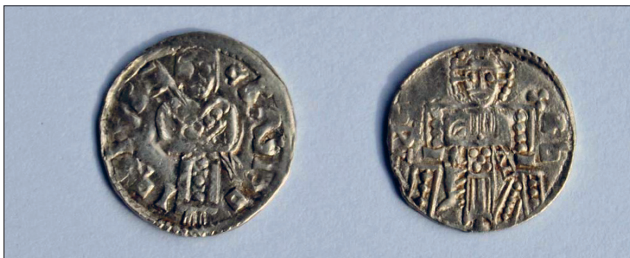
Sl. 8. Avers i revers novca Vuka Brankovića