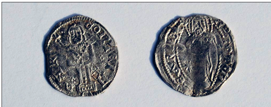
Sl. 7. Avers i revers novca Lazara Hrebeljanovića

Pronađeni novčići daju materijalne dokaze o približnom vremenu podizanja ovog reprezentativnog objekta i njegovim fazama obnove i negiraju dosadašnje shvatanje da je crkva podignuta poslije obnove pečkog trona (1557) i svojevrsne obnove crkava na prostoru nekadašnje Srbije. 17