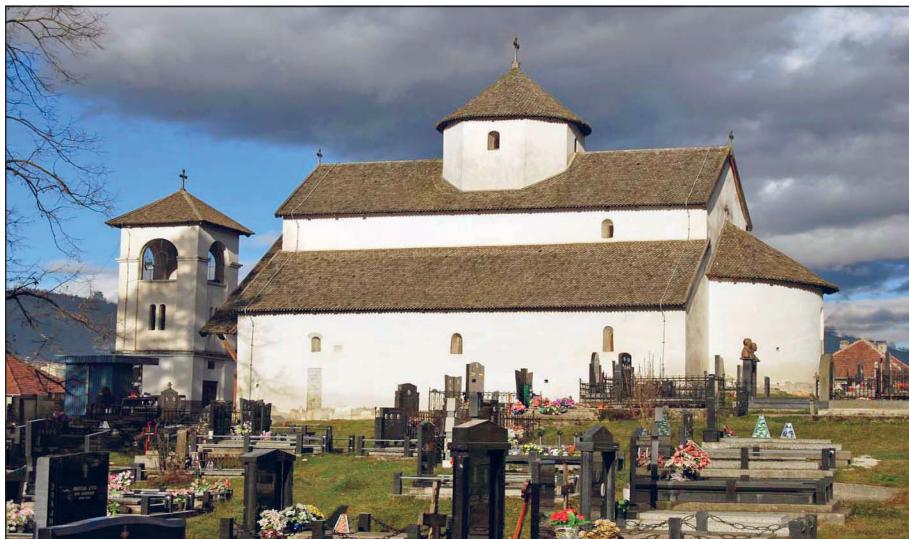
Sl. 1. Crkva Sv. Nikole — Nikoljac kod Bijelog Polja

do 1392. godine, zauzeo: bjelopoljski kraj, Budimlju i Plav i vladao do 1396. godine. 10 Poslije sloma Vuka Brankovića 1396. godine, njegovim dijelom Polimlja (Gornje i dio Srednjeg) upravljao je knez Stefan Lazarević. Ovaj dio Polimlja ostao je u sastavu srpske srednjovjekovne države sve do pada pod osmansku vlast 1455. godine. 11