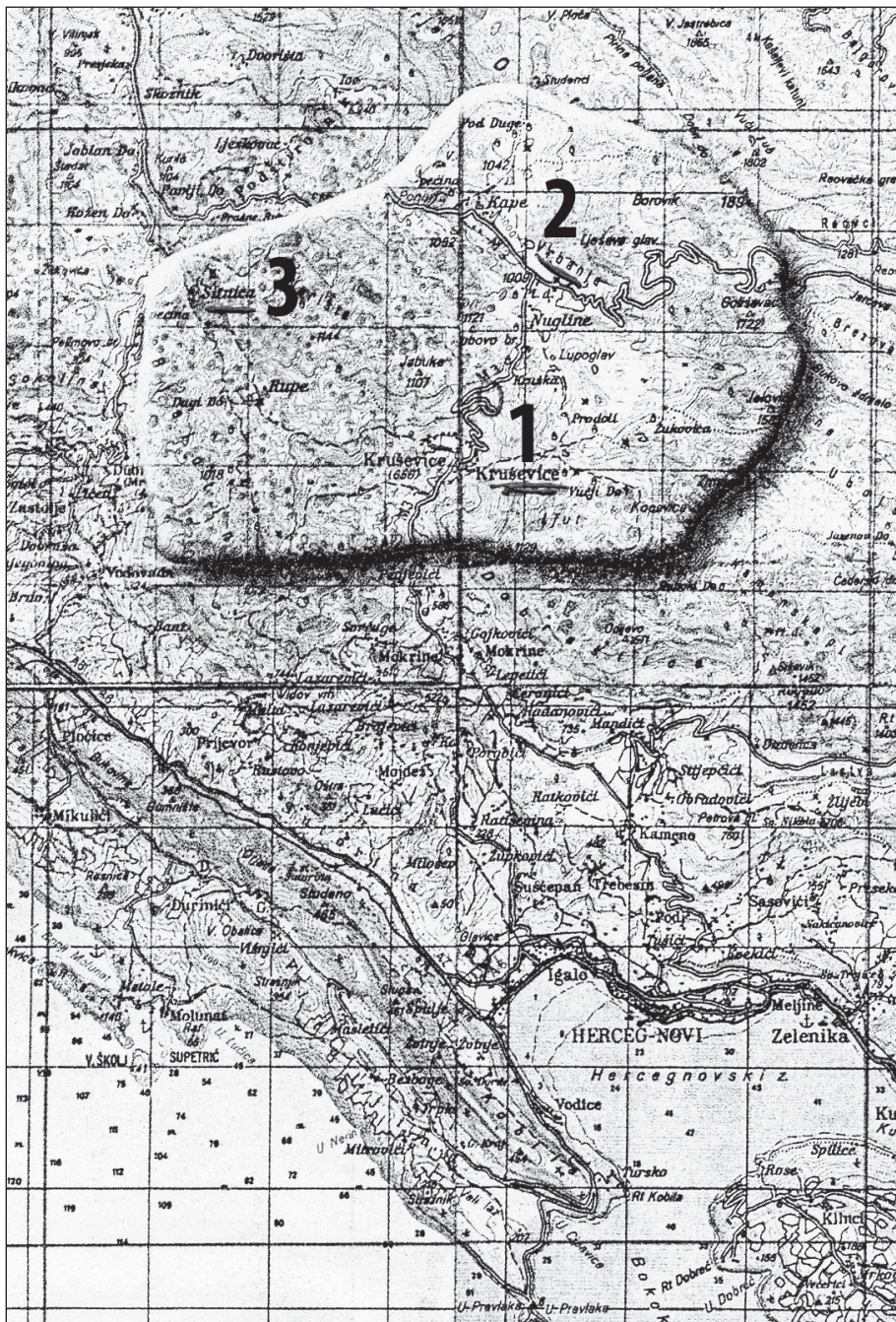
Географски положај Крушевица 1. Крушевице, 2. Врбањ, 3. Ситница