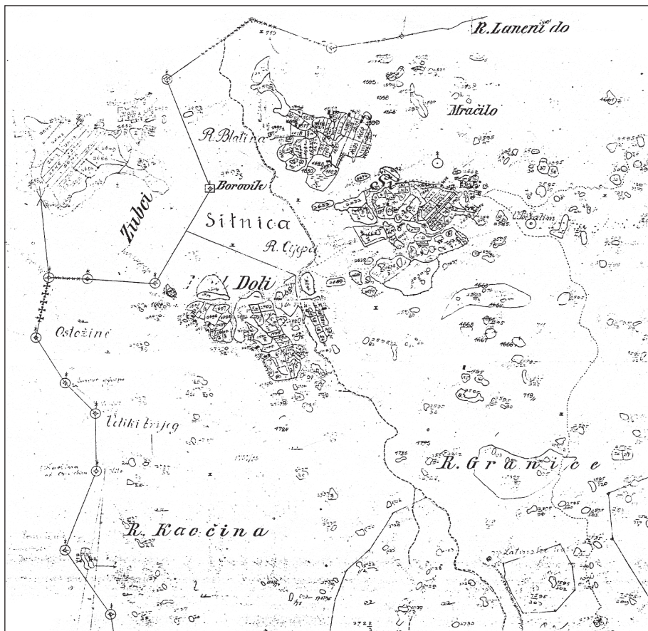
Катастарски план Ситнице из доба Аустроугарске – тремеђа Црне Горе, Републике Српске и Хрватске