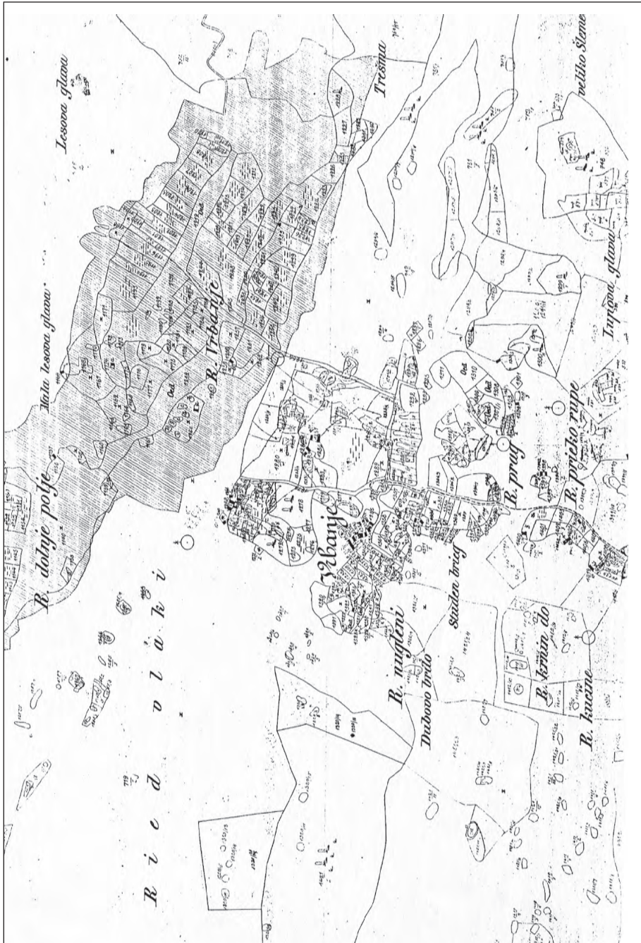
Катастарски план Врбања из доба Аустроугарске