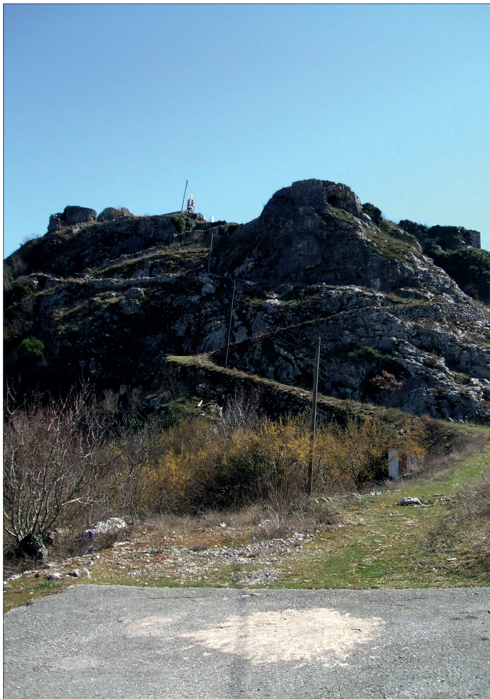
Današnji izgled tvrđave Medun