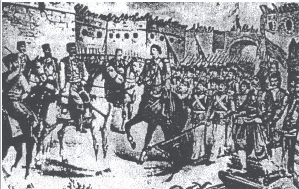
( гравира Хатора : Предаја Медуна и улазак црногорске војске у град. Предпоставка је да је у Доњем граду извршена предаја.)

pominje se dosta kasno, u II vijeku kod Ptolomeja, mada je status municipija stekla krajem I vijeka. Medun je u vrijeme Rimljana imao sporednu ulogu, kao vojno utrdjenje i vojna osmatračnica i predstraža Dokleje, kao i za kontrolu važne komunikacije koja je prolazila kroz Duklju od Narone do Skadra. 2