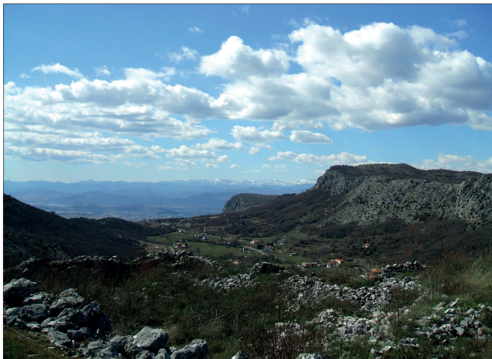
Pogled sa tvrđave Medun na Podgoričko-skadarski basen

vići ili Belmuževići), koji su predali Medun Stevanu Crnojeviću koji je postao oblasni gospodar u Zeti i bio jedno vrijeme mletački vazal. Turci su konačno osvojili Medun 1457. godine. 3