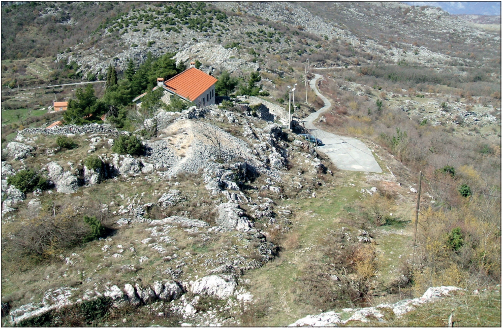
Pogled sa gornje tvrđave na donji dio grada i današnji Muzej

Na teritoriji današnje Crne Gore, u unutrašnjosti, nalazi se Meteon (Medun). Tip i konstrukcija gradskih zidina ukazuju da grad potiče iz III vijeka pr. n. ere.