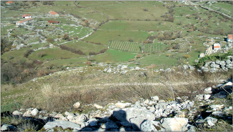
Pogled sa tvrđave na selo Medun

stih sukoba i ratova sa njima, smatrajući ih Varvarima, tako da se za najpouzdanije izvore smatraju ostaci materijalne kulture.