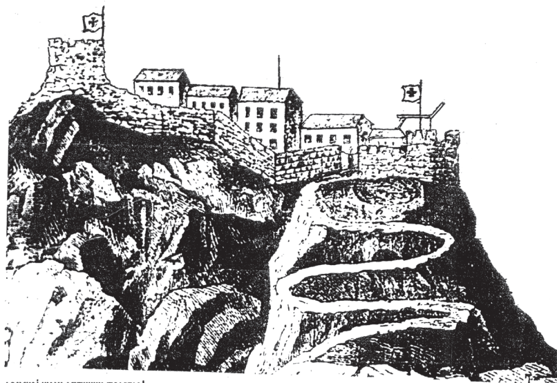
ДЕЛНОЈ КУЋИ ОПТИЧНИ ТЕЛЕГРАФ СЕ УПОТРЕЂИВАО ОД ХVII В.)

Evidentno je, prema istorijskim izvorima, da su plemena, odnosno njihova aristokratija bliža jadranskoj obali i oko Skadarskog jezera, bila pod uticajem grčke kulture. U grčkim kolonijama i emporijama-trgovima bila je prisutna i helenizacija.