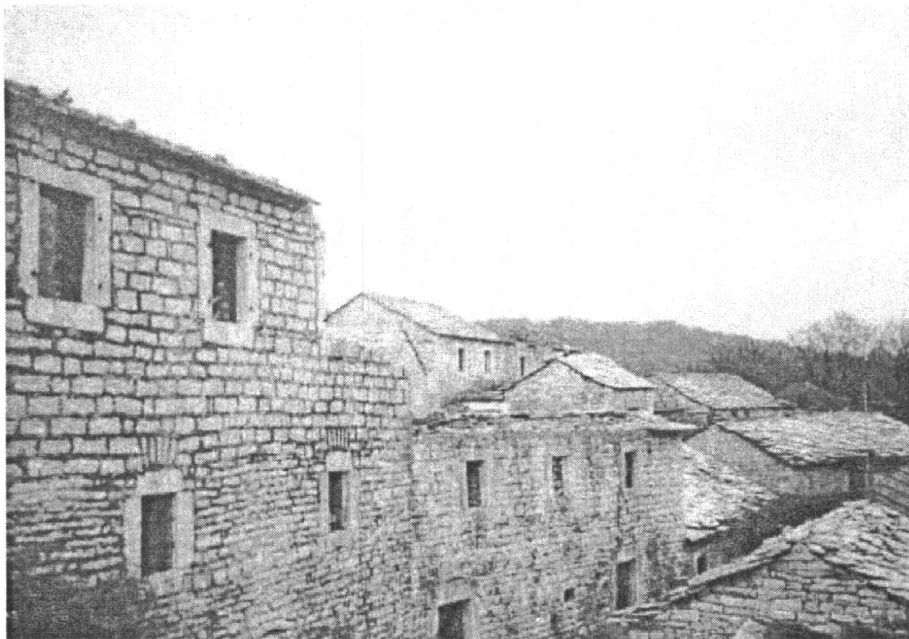
1. Куће у низу засеока Вукасовића