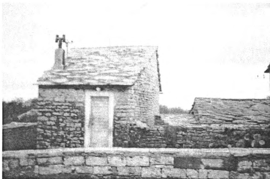
2. Мала кућа Данила Вукасовића