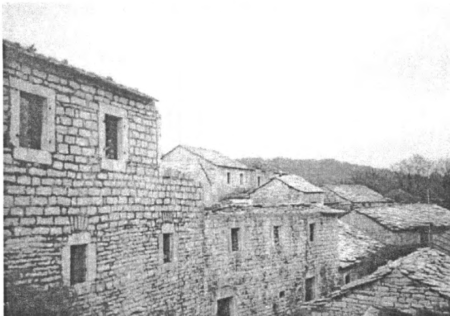
1. Куће у низу засеока Вукасовића