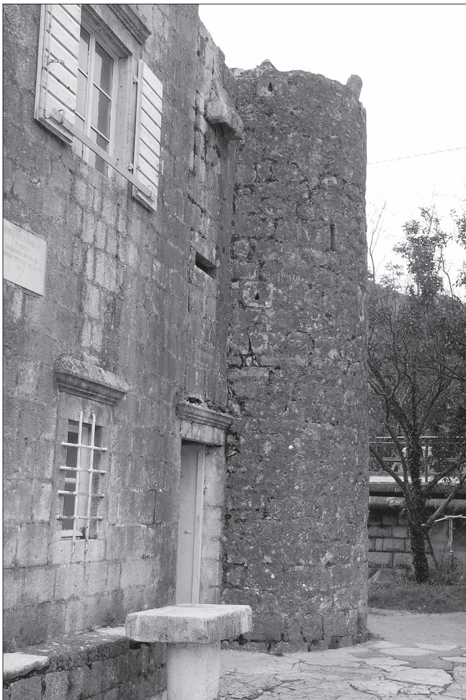
Угаона кула и машикула на кући Милиновић у Морињу