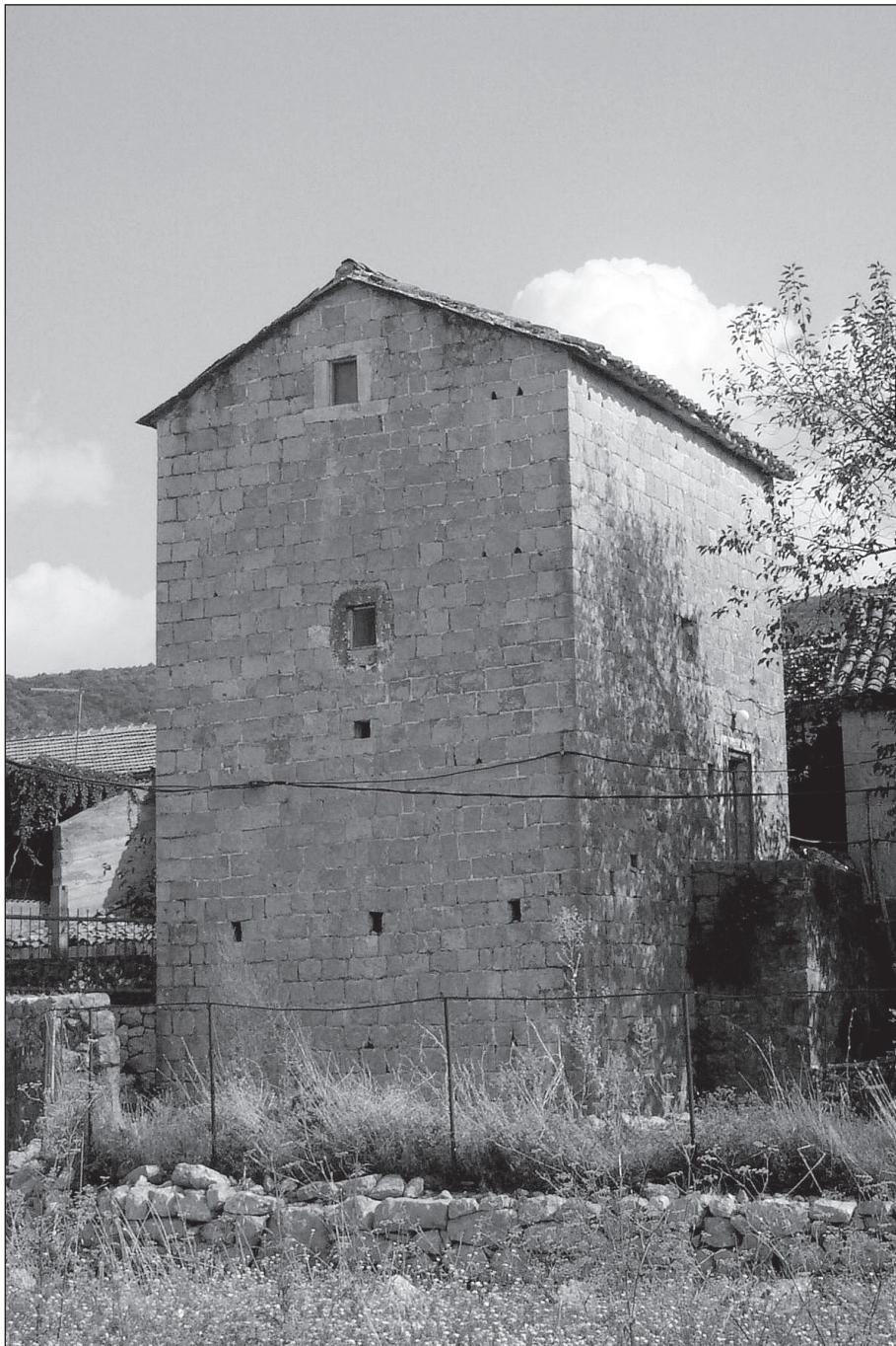
Каштио у Маровићима (Луштица)