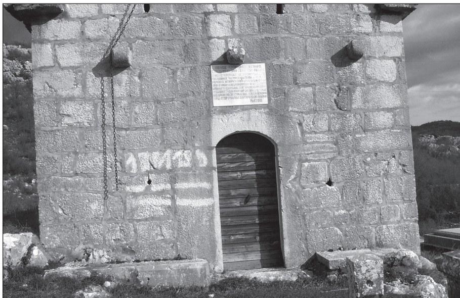
Црква Успења Богородице, Ресна (деталј фасаде)