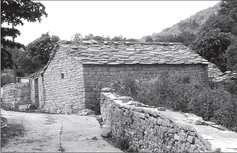
Камена кућа у Жлијебима (Херцег-Нови)