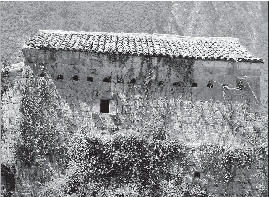
Црква Св. Томе са пушкарницама, Лимљани, Црмница