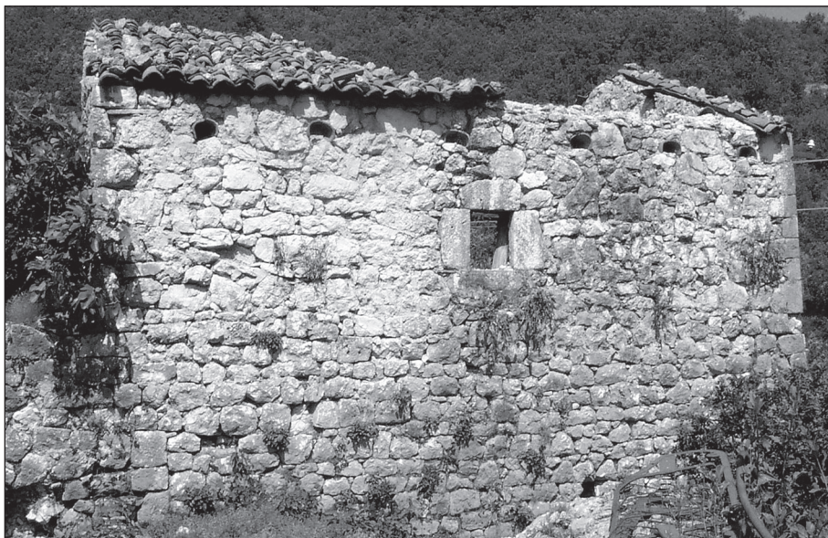
Кула Бановића у Прекорници