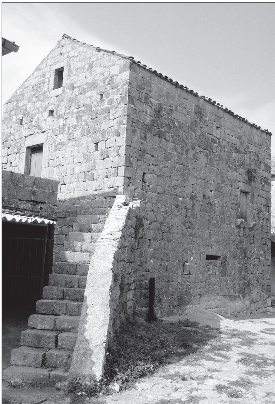
Кула са пушкарницама и спољним степеништем у Радованићима (Луштица)