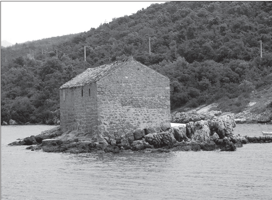
Рибарска кућа у Кртолима (Бјелила)