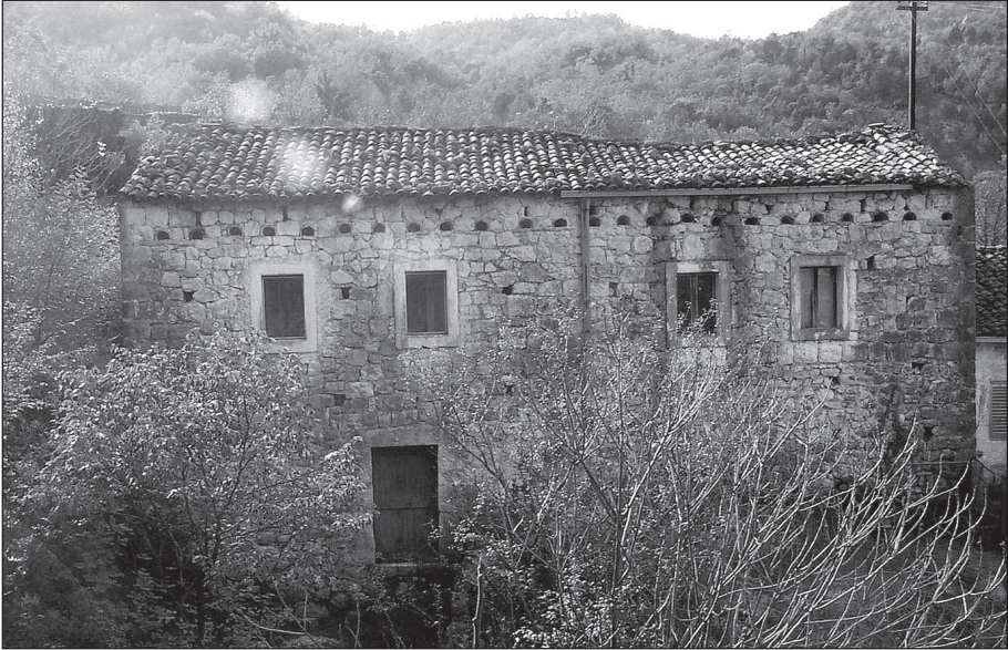
Кула Лековића у Годињу