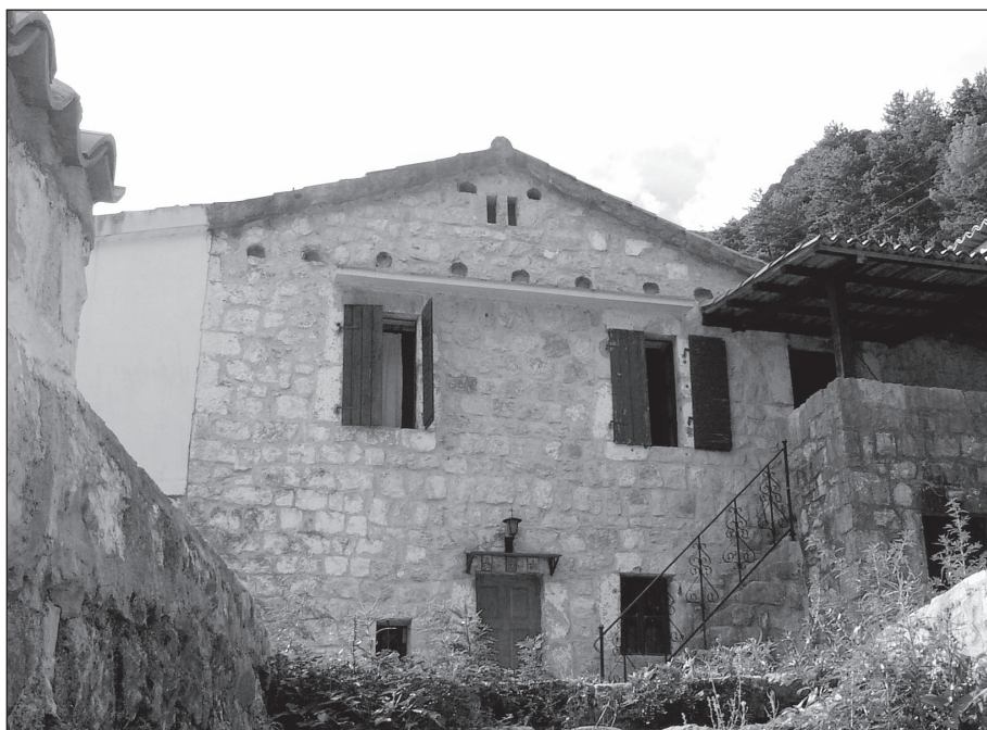
Кућа Св. Петра Цетињског у Ријечи Црнојевића