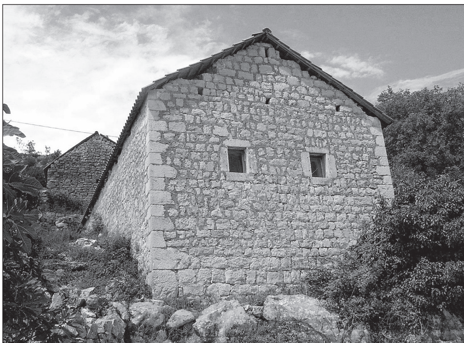
Кућа са пушкарницама у Прогановићима