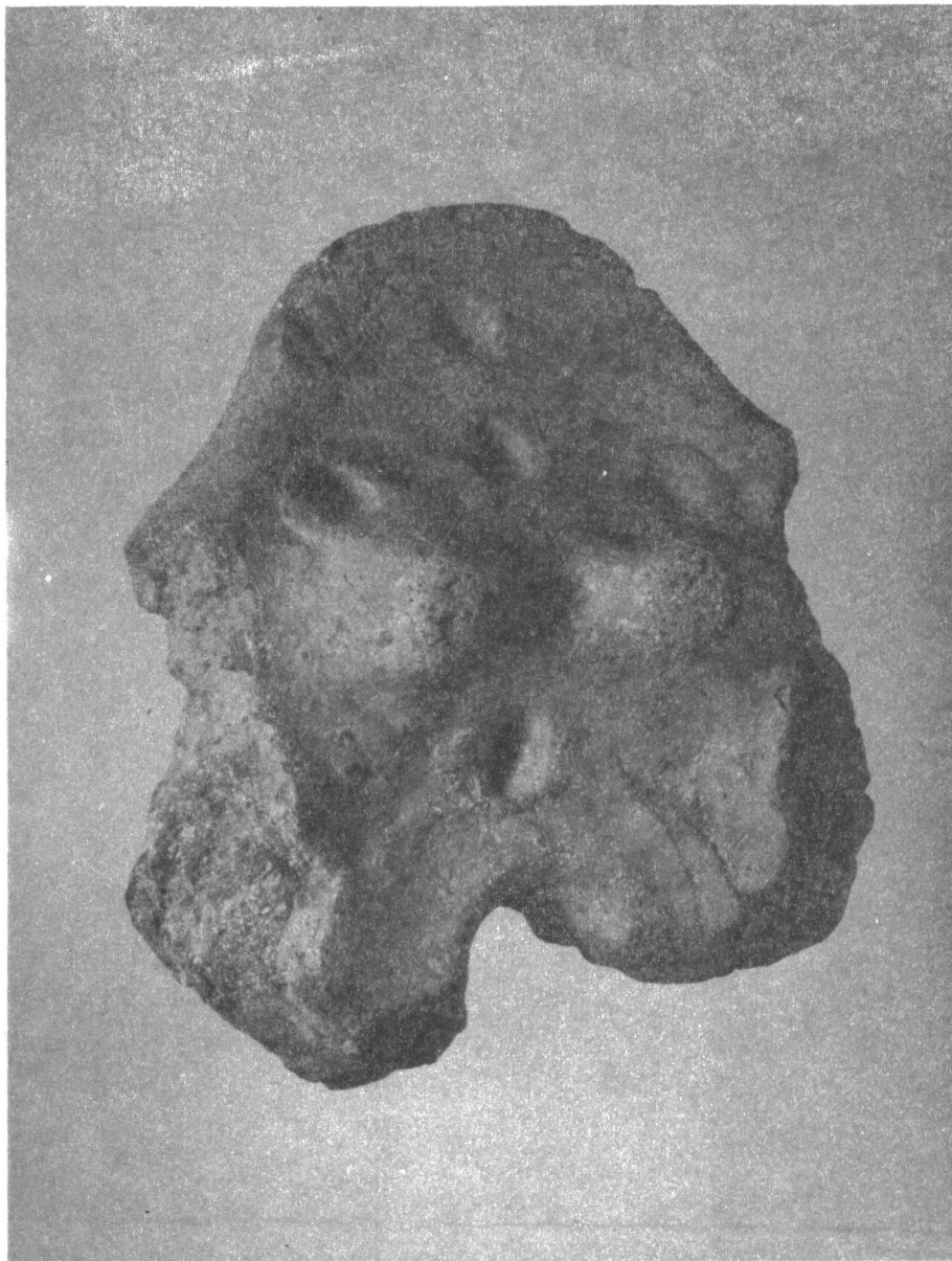
Сл. 1 - Керамички идол из Улциња