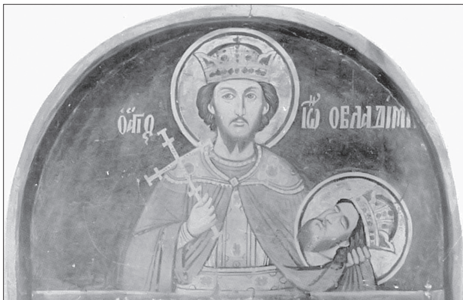
Sl. 9. Sv. Jovan Vladimir, freska u manastiru Filoteju, Sv. gora, 1765.g.