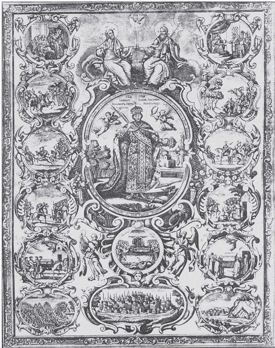
Sl. 12. Hristifor Žefarović, Sv. Jovan Vladimir sa žitijskim scenama, bakropis, Beč, 1742. g.