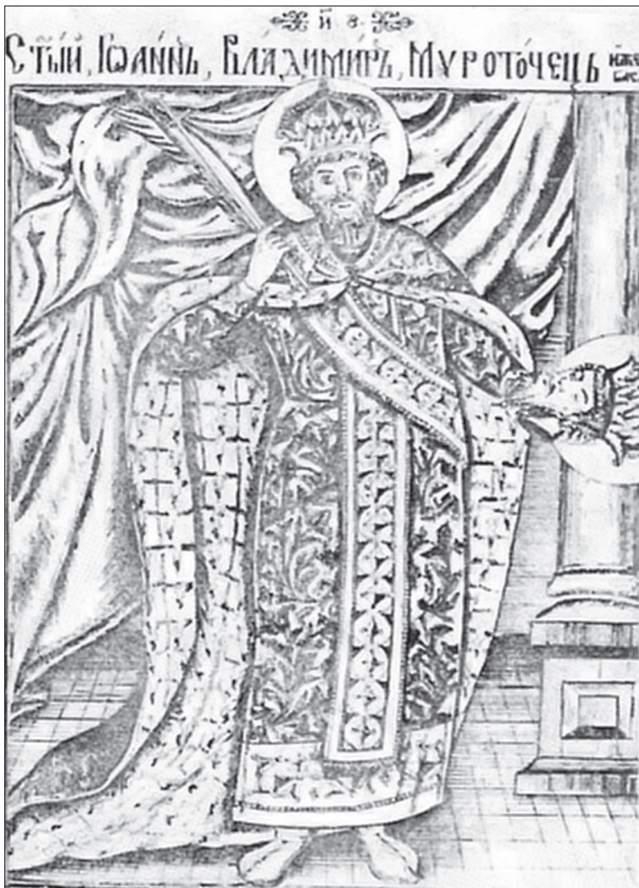
Sl. 4. Sv. Jovan Vladimir, Hristifor Žefarović, Stematografija , Beč 1741.