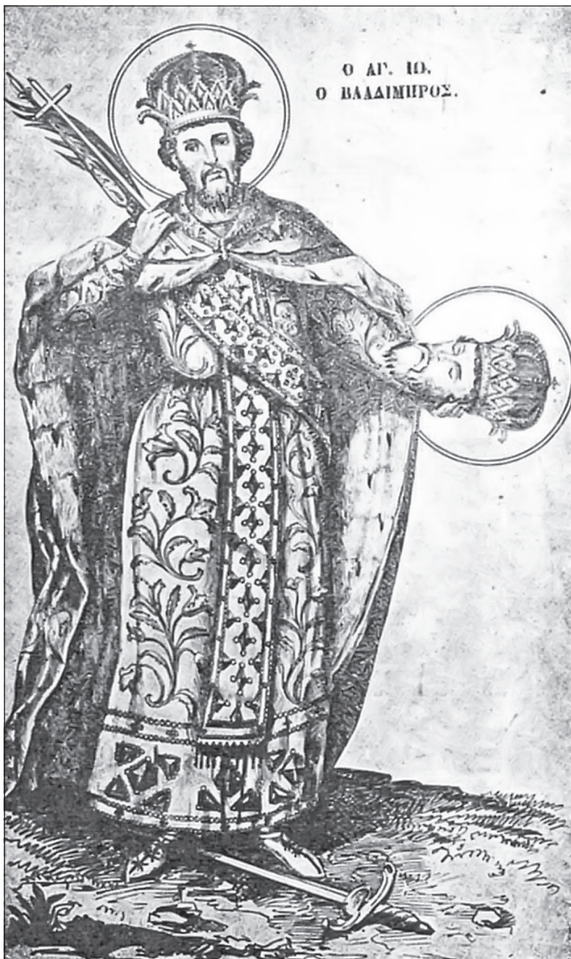
Sl. 2. Sv. Jovan Vladimir, Akolutija (3. izdanje), Venecija 1858.