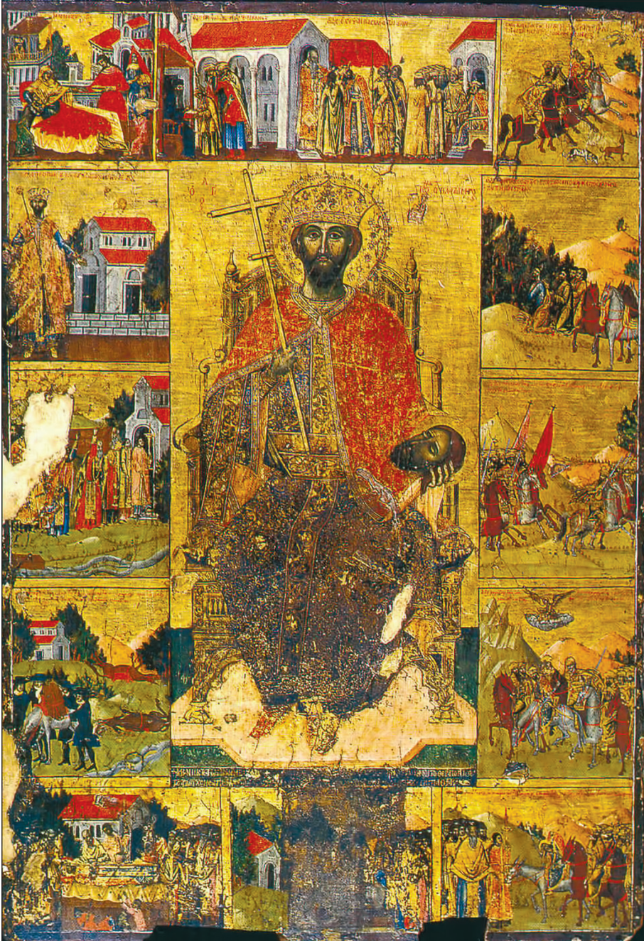
Sl. 6. Konstantin Špataraku, ikona sv. Jovan Vladimir sa žitijskim scenama, 1739. g. (Muzej srednjovjekovne umjetnosti, Korča, Albanija)