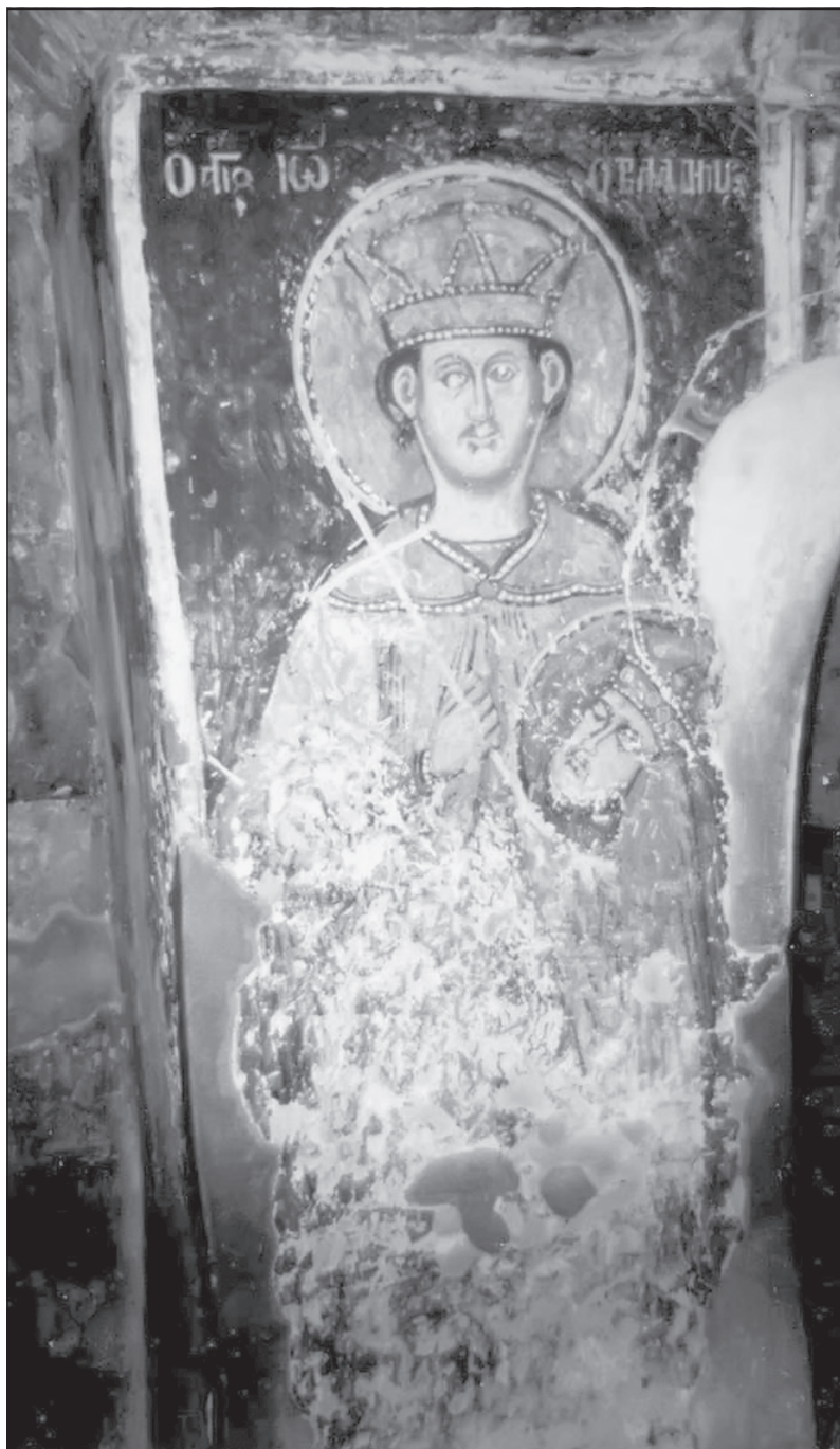
Sl. 8. Zograf Trpo iz Korče, Sv. Jovan Vladimir, freska u Sv. Naumu 1806. g