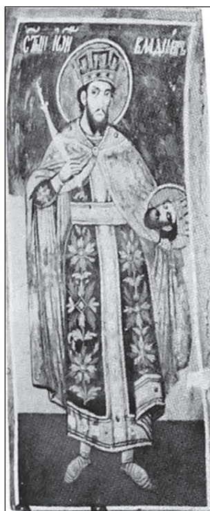
Sl. 10. Sv. Jovan Vladimir, freska u manastiru Hilandar, Sv. gora