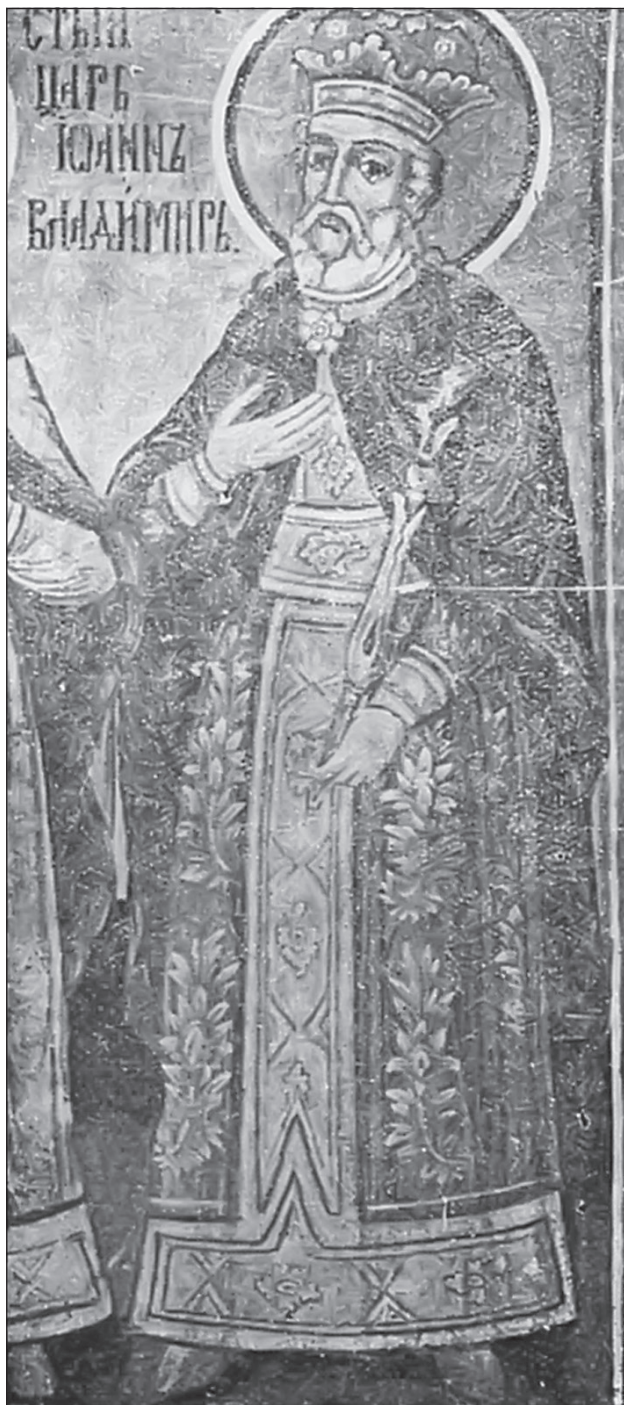
Sl. 13. Zograf Zaharije, Sv. Jovan Vladimir signiran kao „Sveti car”, Trojanski manastir, Bugarska, 1848. g.