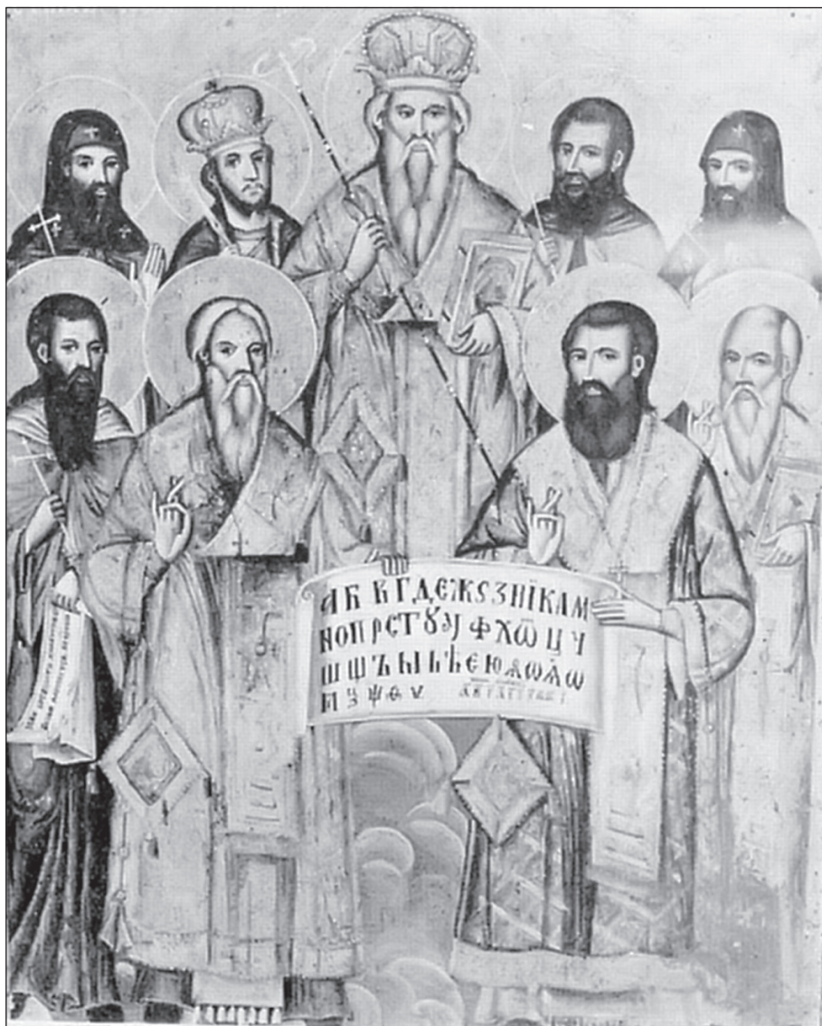
Sl. 5. Zograf Dičo, Sv. Jovan Vladimir sa Sedmočislenicima i sv. Erazmom, ikona, Kamensko, Ohrid, kraj 19. v.