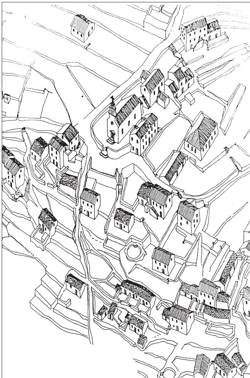
Сл. 3. Г. Ластва – постојеће стање

Горња Ластва је „риједак примјер традиционалне цјелине, потпуно сачуване од ерозије савремене градње. У насељу се налази 55 542