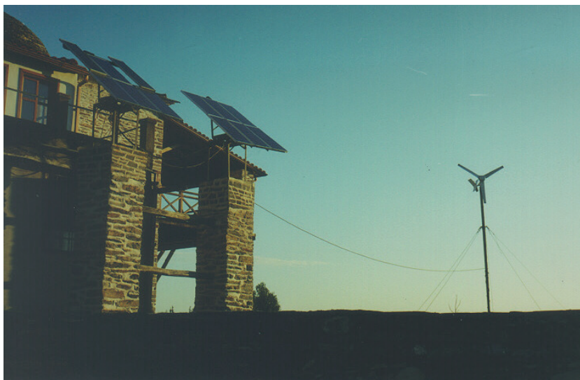
Slika 3: Obnovljivi sistem napajanja na keliji svetog Nikole

mer, napravljeno je i rešenje sa akumulatorskim napajanjem tako da se napajanje u noćnim časovima obavlja nečujno. Ovo rešenje je opisano detaljnije u radu [5].