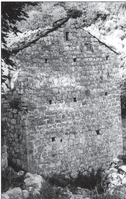
Карактеристичне пушкарнице на кући Руцовића

Позната је анегдота за Подострожане из овог времена. Када им у кућу изненада дође гост, рекли би „вино им је у Стари град Будву,” говорили су „нема више него је у овој боци”, а када би се сусрели са гостом у Старом граду, рекли би, кључеви од подрума су им остали у селу.