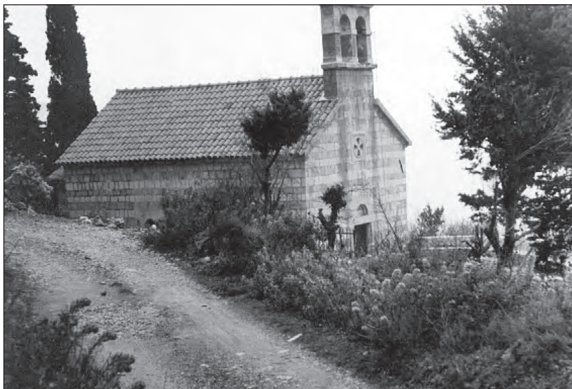
Црква Св. Јован Богослов

са два окна, са једним звоном, а на звонику је бетонски крст. На pročелу је отвор квадратног облика, који у прорезу ствара крст, а у чијем се централном дијелу налази круг израђен у каменој пластици.