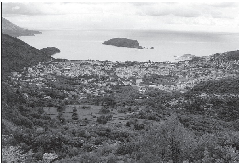
Поглед на Будву из Подострога

Подострог има и издвојених кућа али су већином повезане у више архитектонски складних цјелина.