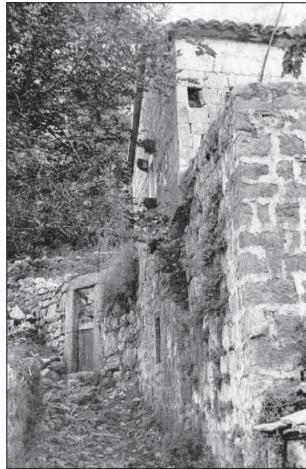
Конзоле на кући Тановића

У саставу двора или окућнице, у непосредном додиру, распоређене су зграда и површине за одвијање економије.