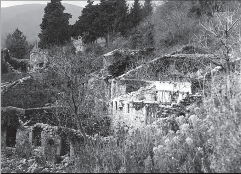
Рушевине Алексића, Тановића и Вукићевића

Општи архитектонски утисак за Подострог је да има добар ритам простирања, док у руралном рјешењу дјелује веома сликовито, са уским улицицама (стазама) које се већином слијепо завршавају.