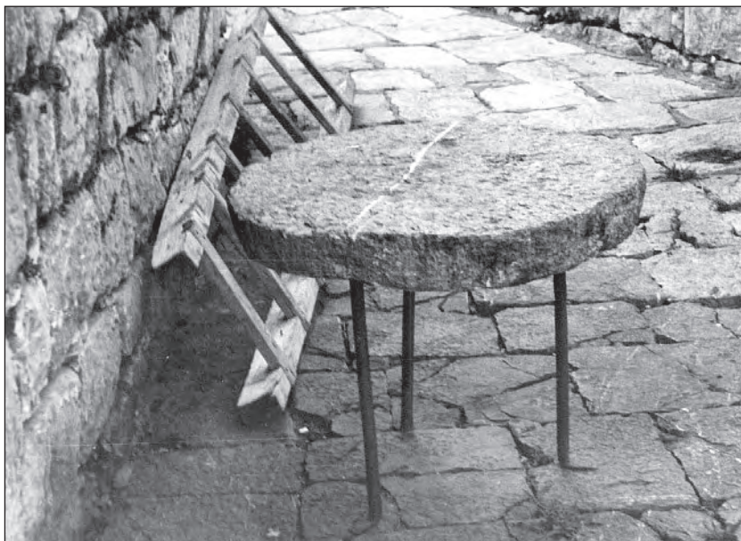
Камени сто Тановића

Непосредно код манастира Подмаине премошћен је поток Грђевица (Маинска ријека) мостом, којег је по предању саградио владика Данило, између 1696. и 1700. године. Овај мост се и данас користи. Истовремено са мостом на Грђевици саграђени су били „Воденица за кукуруз и пшеницу и издвојени млин за уље. Оба млина су нестала 1869. године, приликом велике поплаве, односно провале облака у планини Острог, када је и један од Божовића у бујици потока погинуо, непосредно пред млин”. 4 И данас се уз поток Грђевицу могу видјети темељи разрушених млинова. Потреба за млином за уље натјерала је Подострожане да саграде нови уз манастир Под-