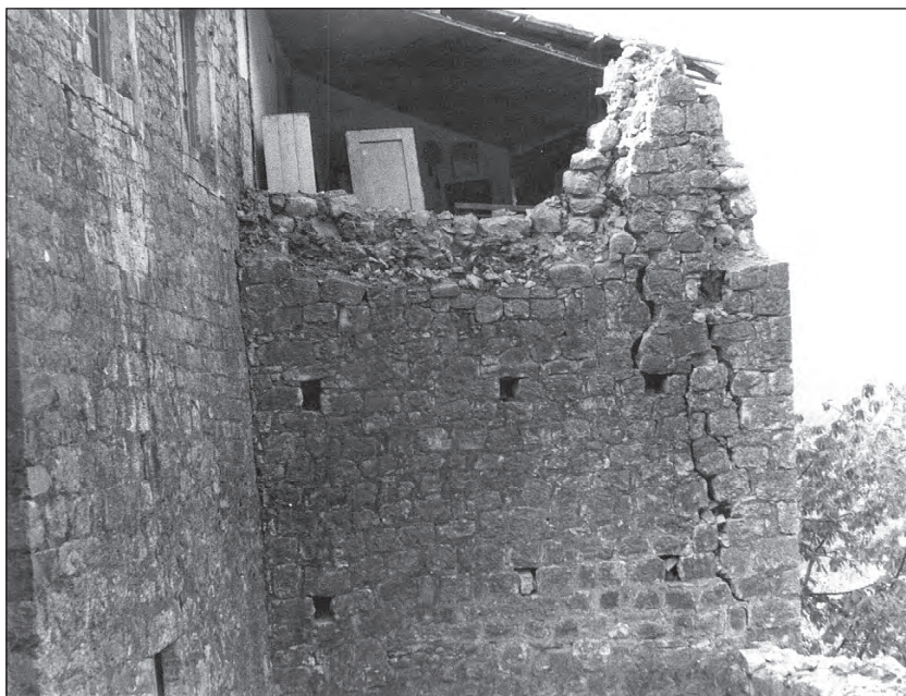
Детаљ куће Божовића

Поред куће као главне стамбене зграде и кухине која је засебно дограђивана, постоје појата или трница и најчешће је грађена уз гувно. У њој се држала слама и сијено. Стока, краве, овце, козе, коњи, магарци су држани у коноби. Уз њих су били свињарници.