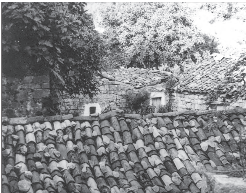
Кровови кућа на врху села

је био гвоздени треножац (тријепље) на коме су стајали судови за кување. Дим са огњишта је излазио кроз кров.