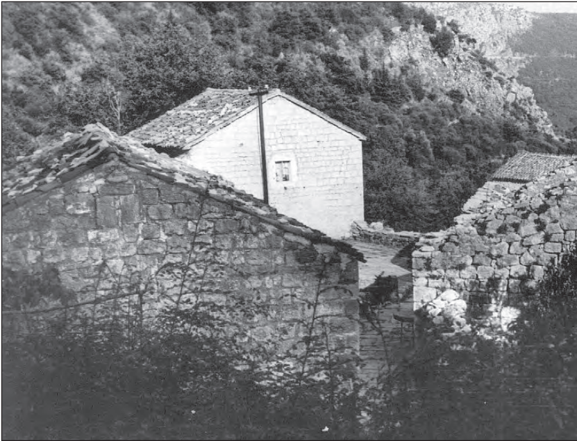
Куће породице Тановић

Зидови код неких приземљуша зидани су усудо, док их је већина грађена помоћу везног материјала. Њихова дебљина је од једног до 1,20 метара. Овдје је кров на двије воде супротно паштровској кући, која је на једну воду, али су обје покривене цријепом каналицом.