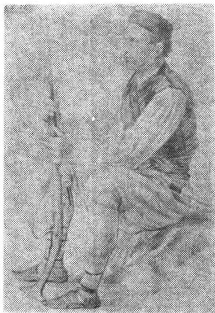
Сл. 3. — Црногорац на стражи