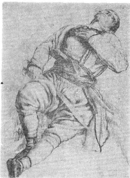
Сл. 1. — Рањени Црногорац