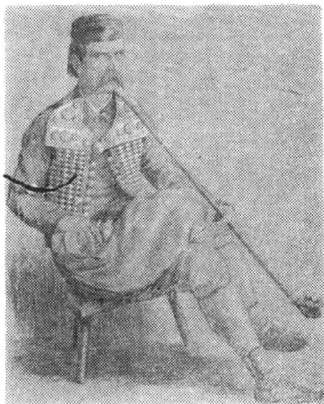
Сл. 2. — Дурмиторски чибукаш