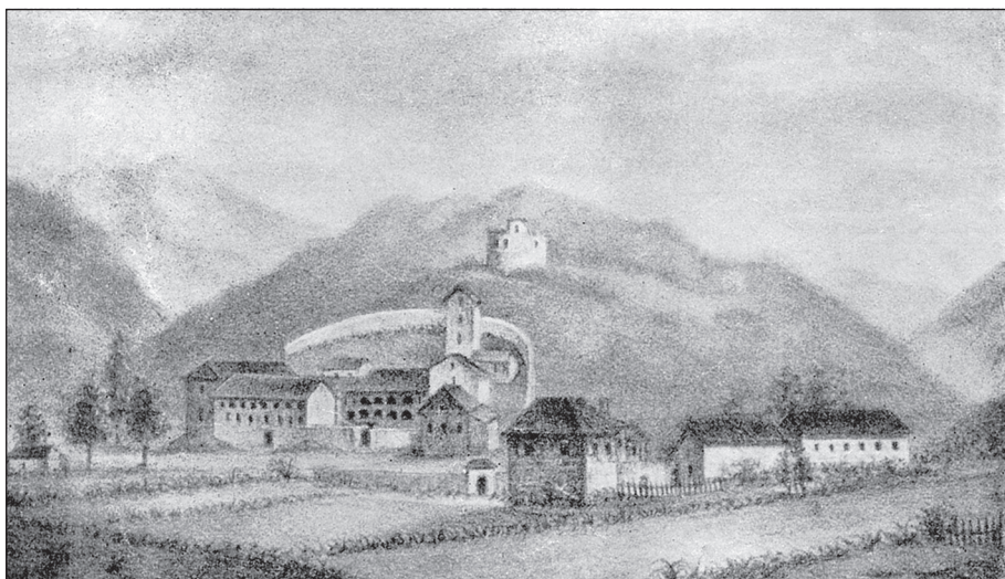
Цетиње – гравура из 1838. године

Преношење владарског и митрополитског трона из зетске низије у подножје Ловћена било је од пресудног значаја за касније формирање националне државе и за стварање од ње „највјернијег