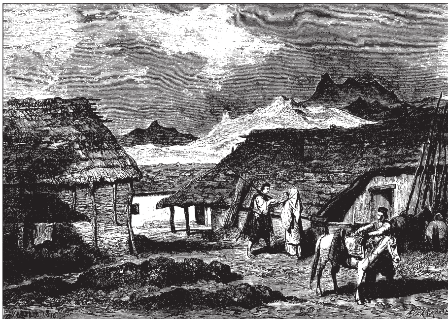
Цетиње – гравура из почетка 19. вијека (деталј насеља)

Новијим проучавањем архивске грађе у Которском архиву, утврђено је да је у граду под Ловћеном било насеља и прије него што га је основао Иван Црнојевић. Наиме, у најстаријим судско-нотарским списима Историјског архива у Котору, Цетиње се по-