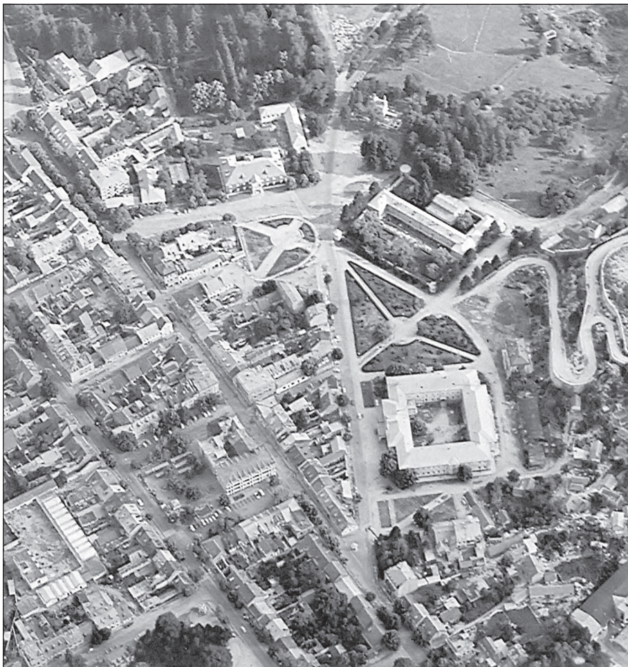
Савремени изглед Цетиња

оницу, која се налазила насамо, власништво „президента” Ђорђија Петровића, коју је био изнајмио неком гостионичару и, напokon, осамљену кућу према Бајицама, намијењену за резерве жита. Према овоме, чини се, доста прецизном и сликовитом опису, било је на Цетињу 40-их година 19. вијека свега 12 кућа, које су „биле окружене добро обрађеним ораницама, док је највећи дио Цетињског поља био под ливадама”. 14 Међу кућама које помиње Ебел било је 6–7