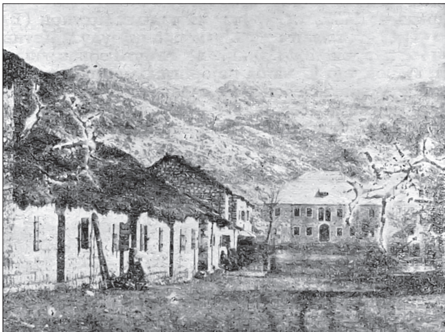
Старо Цетиње, око 1870. године, са првом модерном кућом – угоститељским објектом – хотелом „Локандом” из 1864. године