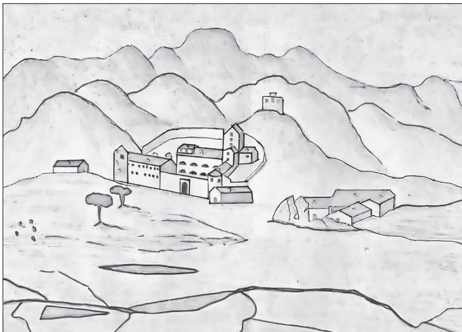
Цртеж Цетиња из 1838. године

Експанзија Турака имала је велике политичке и етничке посљедице. Долази до помицања средишта зетске државе из равни-