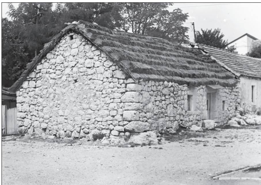
„Катунска кућа” на Цетињу, иако заштићена Законом о споменицима културе, разрушена је 1995. године.

Куриозитетно је дјеловала на домаће и стране посјетиоце. Налазила се преко пута репрезентативног објекта Владин дом, у Медовини, најсиромашнијој четврти Цетиња. Имала је историјско-етнографску вриједност, па је била занимљива и као туристички антропогени мотив. Због атрактивности, била је мета туристичких фото-објектива, записа и новинарских написа... У литератури је