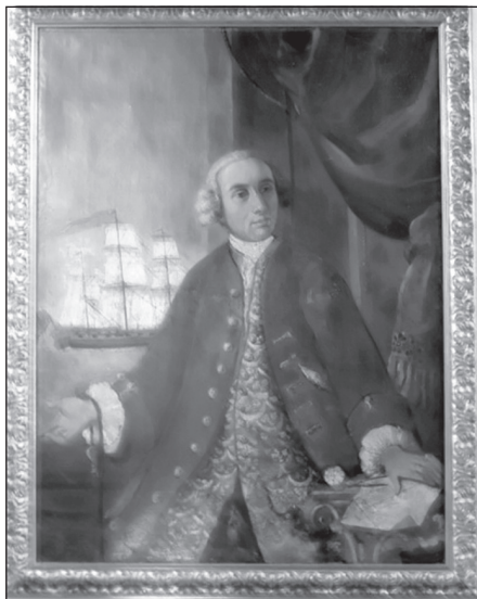
Сл. 3. Капетан Крсто Чорко, XVII вијек