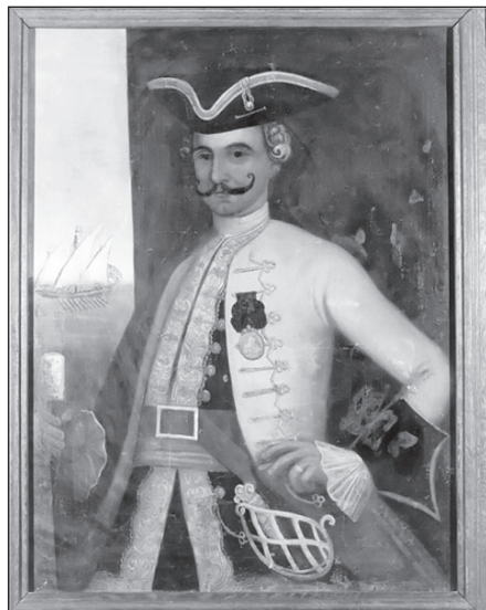
Сл. 4. Кап. Петар Желалић, XVII вијек

на је одлика барокног портрета. Она је оличена у сликању богатих барокних костима са раскошним наборима, бијелих чипкастих кошуља, перика, ордења, сјајног оружја и накита”. 4