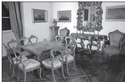
Сл. 8. Салон породице Флорио, XVIII вијек

Барокно огледало заједно са столом – барокном ђотолом (зидним столом) који је украшен са четири стилизоване ноге, на коме се налазе два барокна свијећњака од Мурано стакла. Фјорентина – барокна лампа на уље, са прибором који је служио за паљење и резање фитиља, најбоље свједочи колико су кап. породице у Боки цијениле китњасти стил барока. Самом салону свечану ноту дају барокне завјесе које су састављене из два дијела из горњег, који се завршавао китњастим украсом и бочног, који се спушта до пода а везивао се барокном траком, све у циљу да кроз прозор буде више свјетлости. Салон породице Флорио смјештен је на првом спрату Поморског музеја, а сама просторија одликује се оригиналним подом из 18. вијека – интарзија.