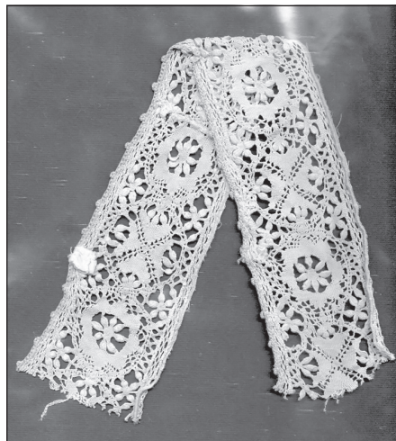
Сл. 12. Добротска чипка

Најљепши примјерци добротске чипке сачувани су у збирци цркве св. Еустахија у Доброти. Збирка обухвата стилски развој бијелог текстилног декора од 16. вијека до средине 19. вијека. Највећи број предмета