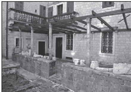
Сл. 17. Барокна тераса палате Гргурина

Посебно мјесто, као што је познато, заузима, као занатска умјетност, доботски вез-чипка па је у циљу очувања овог старог заната потребно отворити радионицу гдје би жене које познају