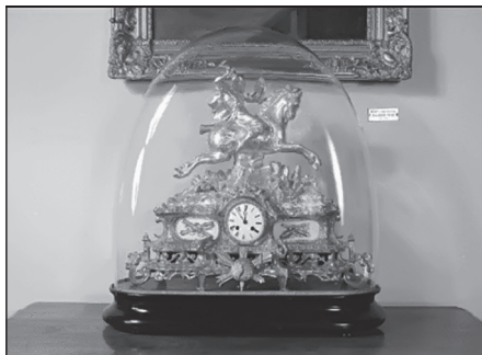
Сл. 11. Француски сат, XVIII вијек

ски сат” (Сл. 11). Тако вриједан експонат, који је добијен од породице Лазари из Прчања, говори нам о љепоти барокног стила исказаног кроз експонат који се зове мјерач времена.