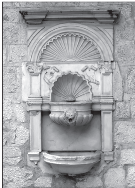
Сл. 2. Умиваоник на тераси палате Гргурина

Лијеп примјер одлике зрелог барока најбоље се може видјети на умиваонику који заузима централно мјесто на тераси палате (сл. 2). Умиваоник је у облику шкољке, урађен такође од корчуланског камена и на њему се налази писани траг: „Палату је саградио племић Марко Гргурина а његови иницијали МГ се налазе на барокном умиваонику на тераси иза палате Гргурина”. 3