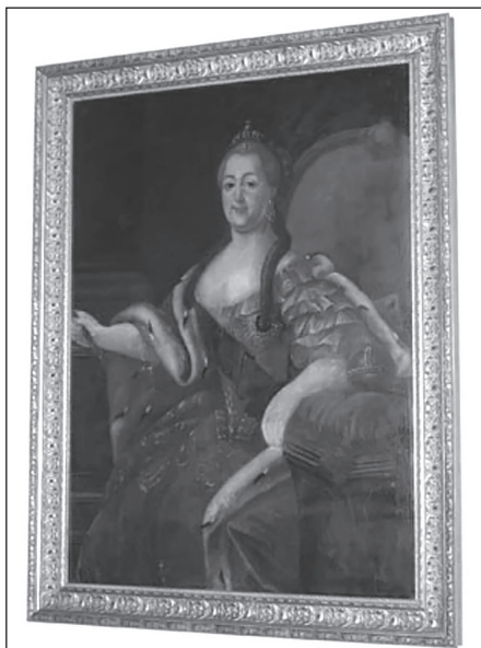
Сл. 9. Руска царица Катарина II

Зидови капетанских салона били су украшени и барокним портретима. Тако у салону породице Ивелић, који је смјештен такође на првом спрату Музеја, посебну ноту дају два царска барокна портрета руских царица, Катарине II (Сл. 9) и Јелисавете Петрове. „Пуно тијело сакрива раскошна царска хаљина декорисана богатом барокним воланима од прозирног материјала, а преко хаљине пребачен је огртач порубљен и оивичен крзном. С десног рамена према струку хаљине пада тамнозелена трака. Материјал тканине барокно је дезениран у флоралним мотивима”. 9