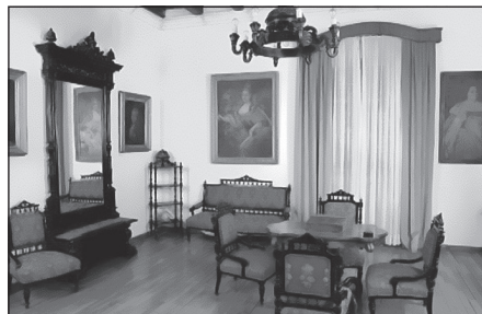
Сл. 7. Салон породице Ивелић, XIX вијек

Салон породице Ивелић из Рисна (Сл. 7) краси намјештај с почетка XIX вијека. Оригиналноост салона огледа се кроз детаље на намјештају који карактеришу период малог барока.