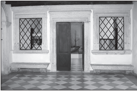
Сл. 1. Хол Поморског музеја Црне Горе, Котор, палата Гргурина, XVII вијек