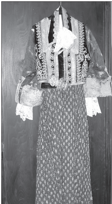
Сл. 13. Женска народна ношња из Доброте