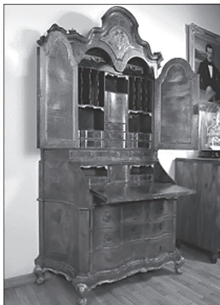
Сл. 10. Секретер, XVIII вијек

Веома риједак примјерак барокног намјештаја је и секретер, креденац из 18. вијека (Сл. 10), који је припадало породици Трипковић из Доброте. Данас овај секретер краси Етнографско одјељење Поморског музеја. Уздигнут од пода на четири стилизоване ноге са три ладице изнад којих је плоча на којој се могло писати. Испод плоче која може да се покреће налазе се ладице, тј. тајни претинци у којима су се чувала писма, накит и документа. Изнад доњег дијела секретера је горњи дио, на коме доминирају двоје врата, која су са предње стране украшена огледалима. Отварањем врата