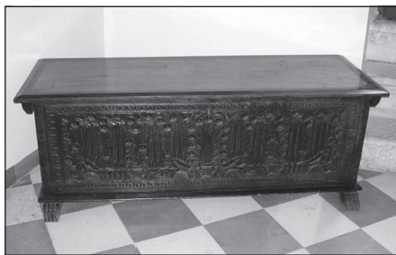
Сл. 16. Дјевојачка шкриња за мираз

Драгоцјени комади накита који су израђивани у которским занатским радионицама, као и живописне народне ношње из Доброте, чувале су се у лијепим барокним шкрињама. У Поморском музеју налази се једна лијепа збирка приморских шкриња, које се мо-