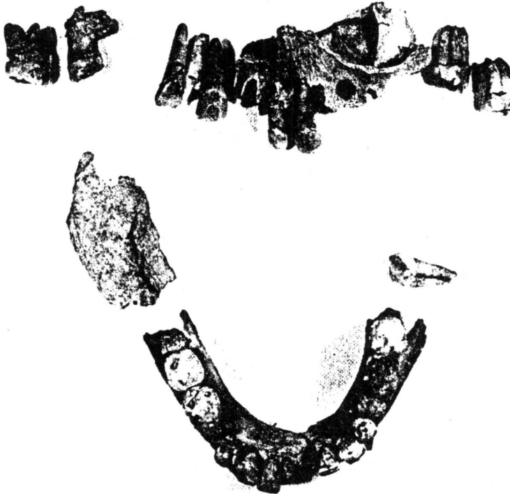
Сл.4. Фрагменти очуване горње и доње вилице Ивана Црнојевића

Maxilla на лијевој страни има: други сјекутић (dentes incisivi), очњак (dentes canini), кутњаке (dentes molares) и то први и други. На десној страни су: оба сјекутића, очњак и други кутњак. Остали зуби у горњој вилици испали су и то post mortem. На мјесту изнад другог преткутњака (dentes premolares) лијево је велика фистула; висине 0,6 а ширине 0,4 мм.