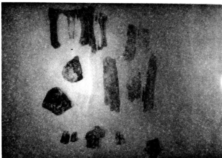
Сл.3. Остаци фрагмената костију и зуба Љеша Црнојевића, који је умро 1435.године и сахрањен у Цркви манастира Ком у Скадарском језеру

ју и њихове карактеристике не омогућавају да се са сигурношћу установи било пол, било старост или било која друга антрополошња карактеристика (Сл. 3).