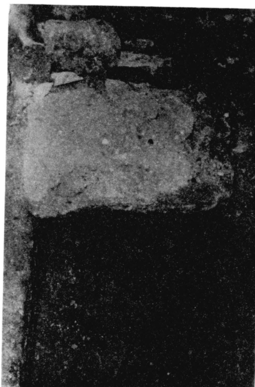
Сл. 2. Гроб са земним остацима Ивана Црнојевића откривен испод подова садашње цркве на Ђипуру из 1886. и испод подова Црнојевића цркве из краја XV вијека