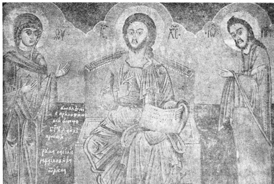
Сл. 3. Василије Рафаилович: Деисис, Доња Сеоца (Црмница)