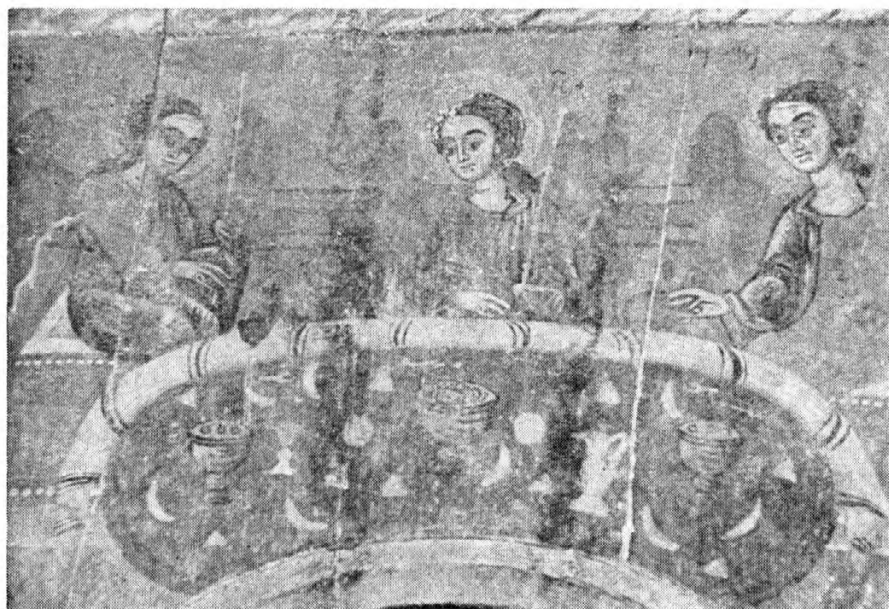
Сл. 4. Василије Рафаилович: Гостољубље Аврамово, Доња Сеоца