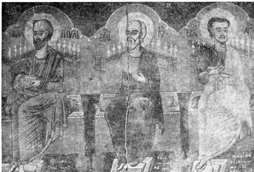
Сл. 5. Василије Рафаиловић: Дно денсисне плоче, Доња Сеоца