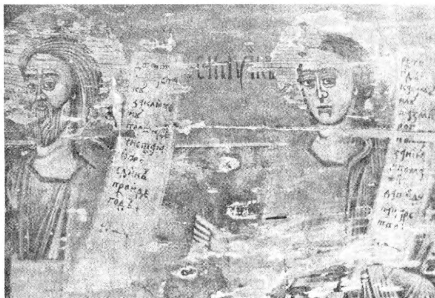
Сл. 6. Василије Рафанловић: Пророци Језекиљ и Самуил, Доња Сеоца