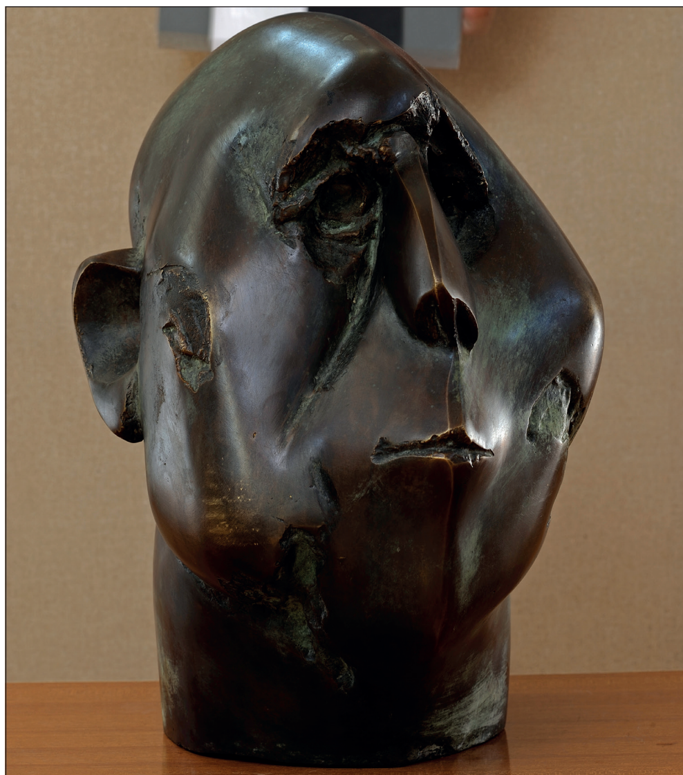
Павле Пејовић: „Аустрија – 39”