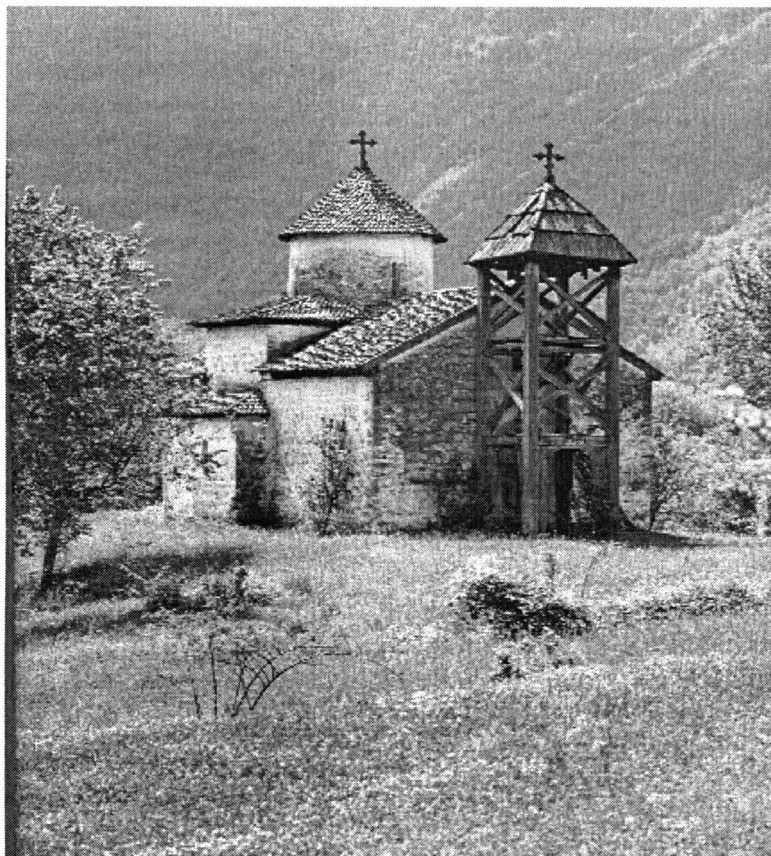
Слика 2. Манастир Добриловина у кањону Таре