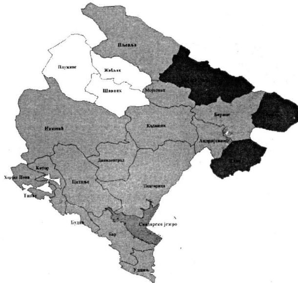
Слика 1. Карта Црне Горе са општинама

(Жабљак 445, Плужине 854 и Шавник 553) или 13,4% територије Црне Горе (слика 1).