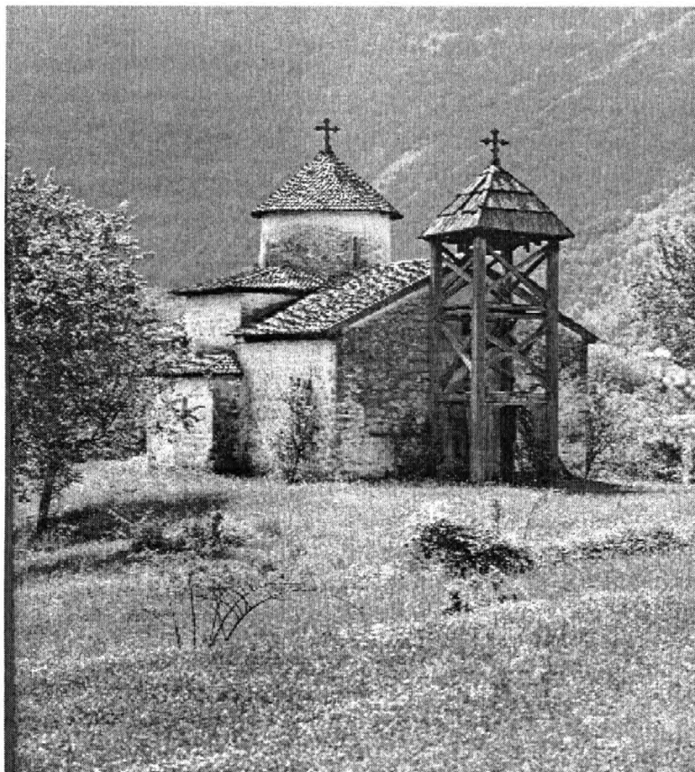
Слика 2. Манасџир Добриловина у кањону Таре